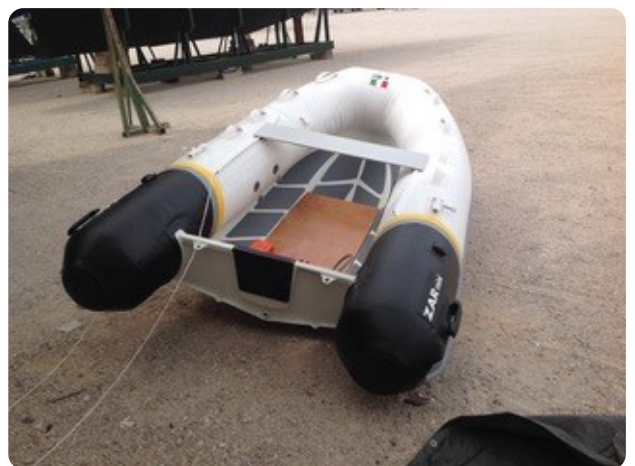
92 Dinghi 2019