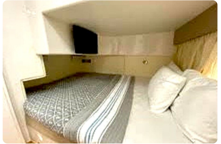
Intrepid 475 SY aft cabin