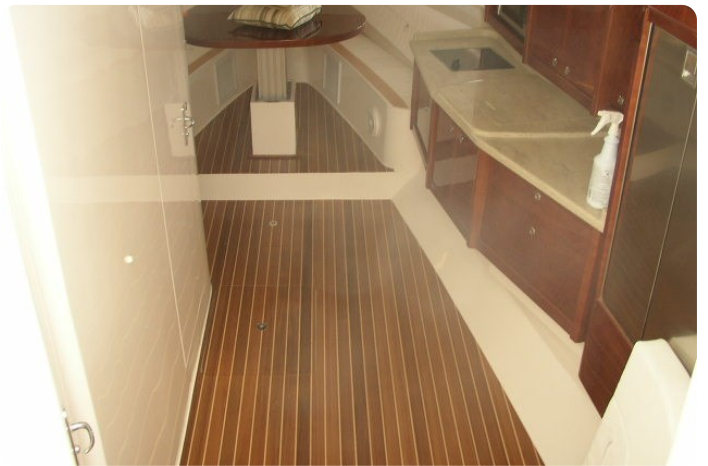
Intrepid 475 SY cabin