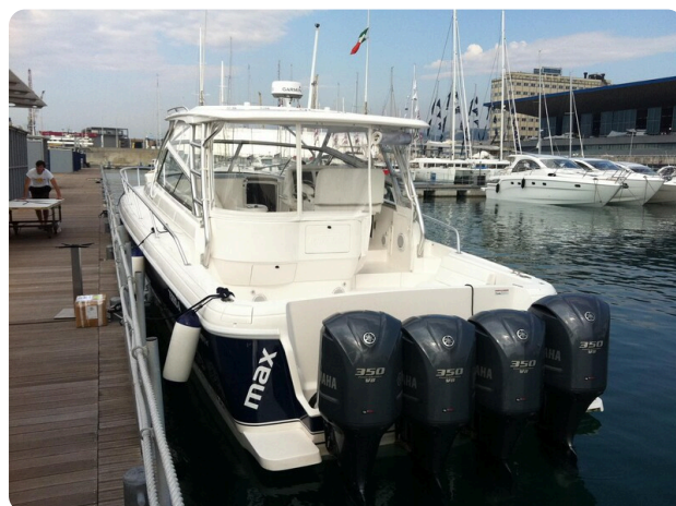
Intrepid 475 SY stern view