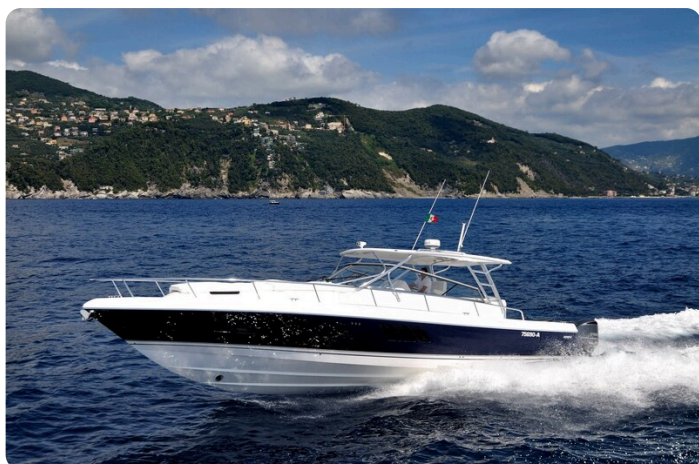
Intrepid 475 SY running