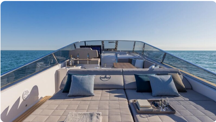
Itama 45RS aft sunpad