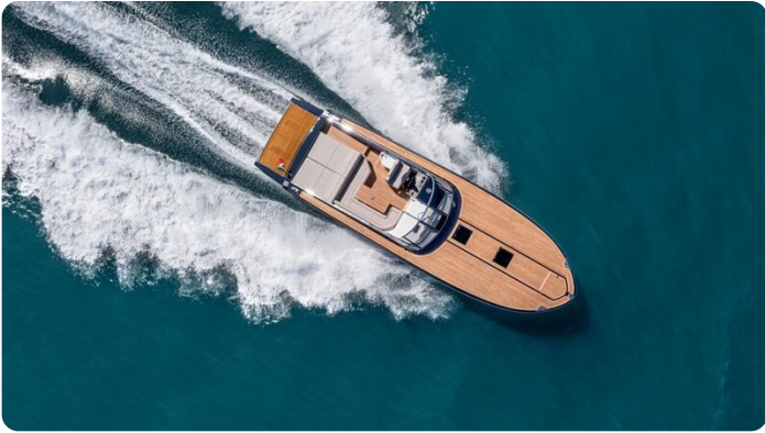
Itama 45RS cruising