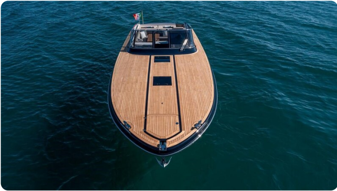
Itama 45RS bow view