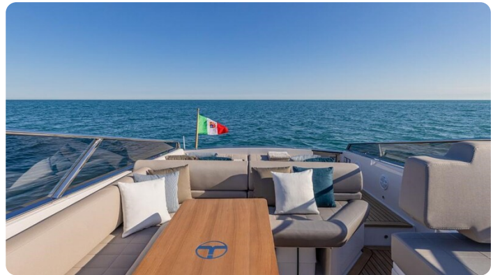
Itama 45RS cockpit dinette