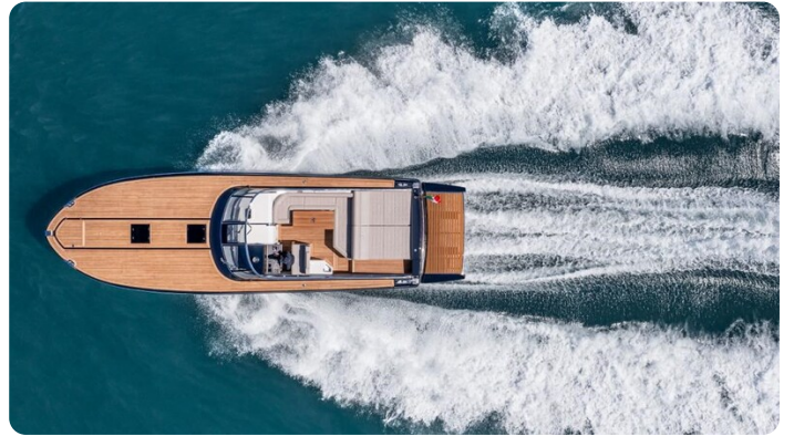
Itama 45RS running