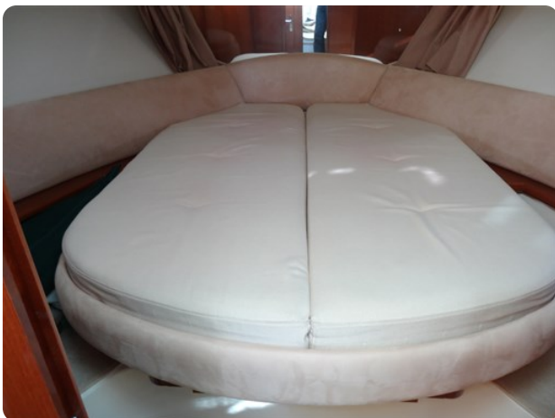
Cabine avant 01