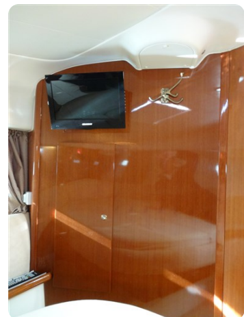
Cabine avant 03