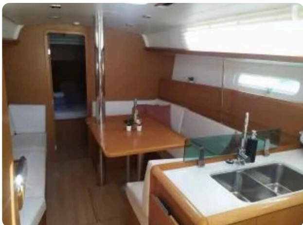
Jeanneau Sun Odyssey 389 ZIVJELLI 6