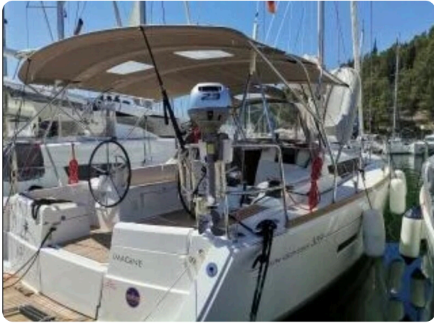
Jeanneau Sun Odyssey 389 ZIVJELLI 4