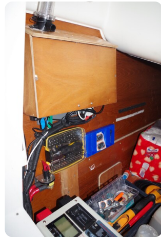
JSO 40.3 44