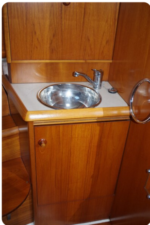
JSO 40.3 52