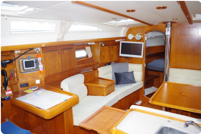
JSO 40.3 29