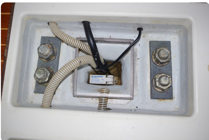
JSO 40.3 54