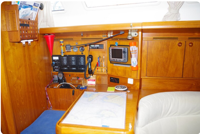
JSO 40.3 35