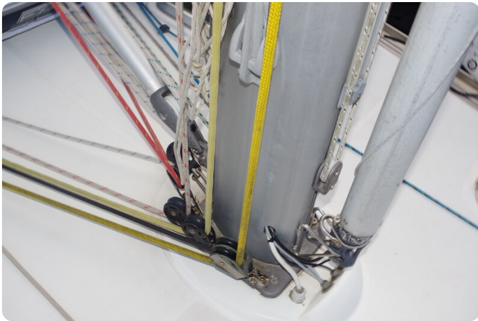
JSO 40.3 17