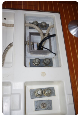
JSO 40.3 53