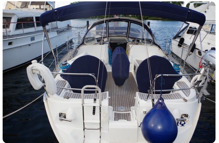
JSO 40.3 5