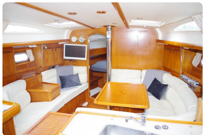
JSO 40.3 28