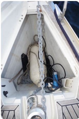
JSO 40.3 14