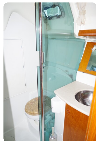
JSO 40.3 37