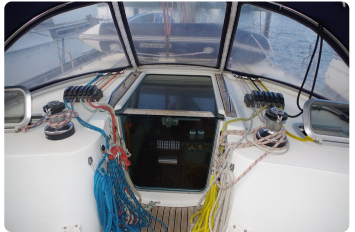
JSO 40.3 7