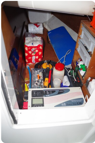
JSO 40.3 42