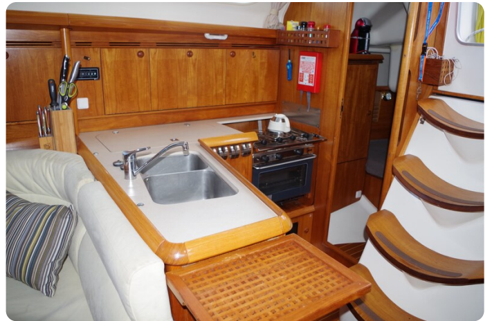
JSO 40.3 33