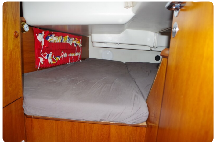
JSO 40.3 39