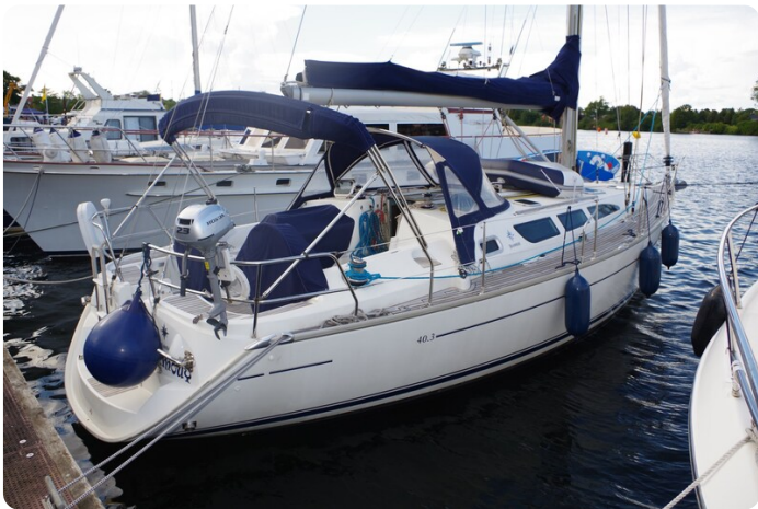
JSO 40.3 3