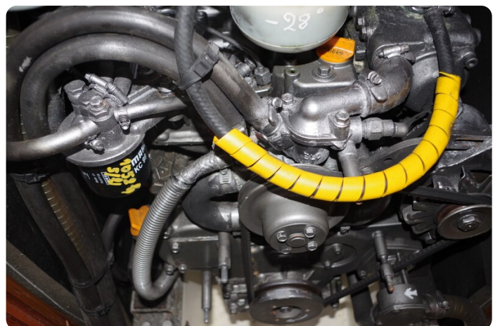
JSO 40.3 58