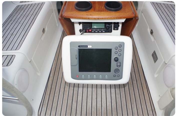
JSO 40.3 25