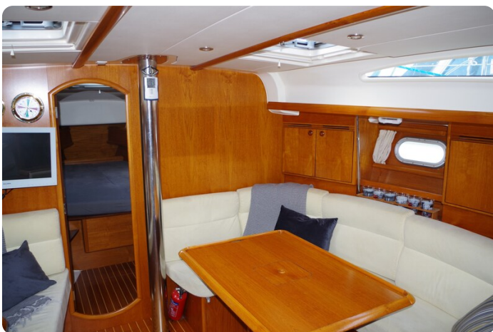
JSO 40.3 27