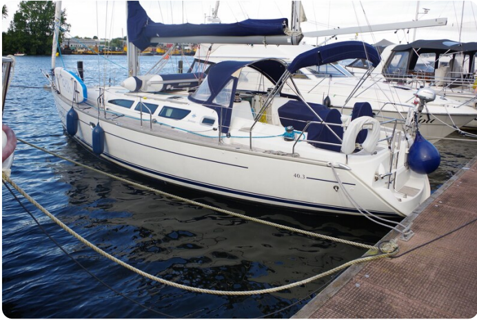
JSO 40.3 1