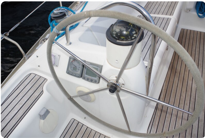
JSO 40.3 23