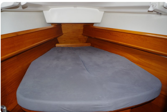
JSO 40.3 48