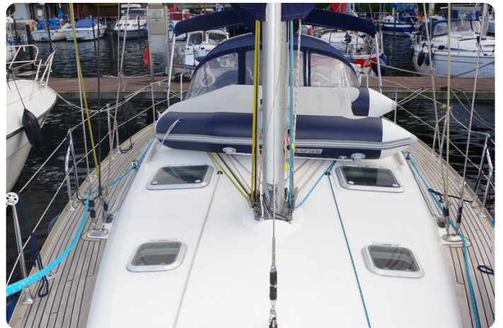
JSO 40.3 15