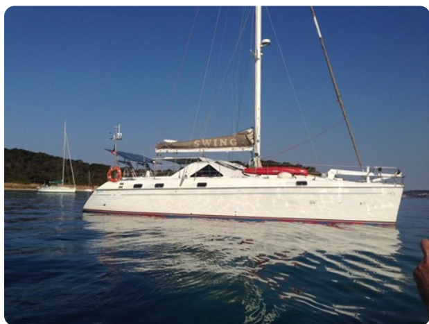
Vue tribord +++