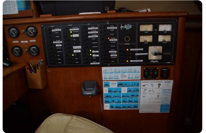
Panneau électrique +++