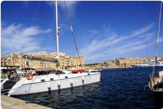
Vue AR Tribord 1 +++