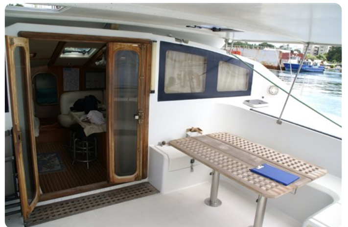
Cockpit 1 +++