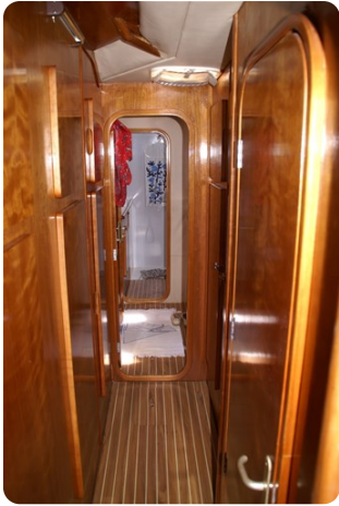
Coursive tribord +++