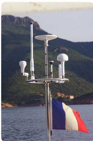
M_t d'antennes AR Tribord +++