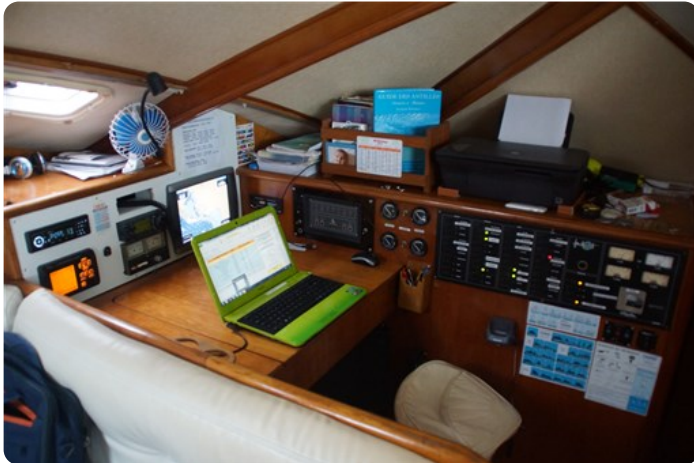
Table à carte +++