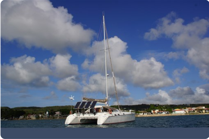
Vue AR Tribord 2 +++