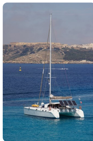
Vue AR Babord +++