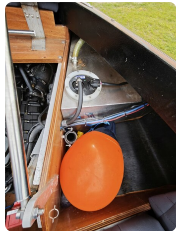
Kaiser 650 Super Sport 12