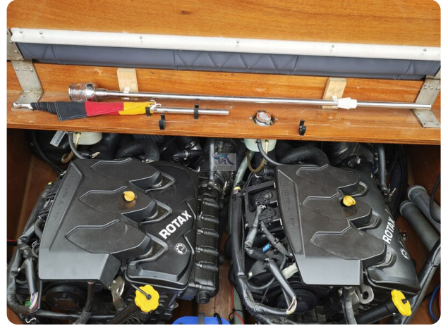
Kaiser 650 Super Sport 23