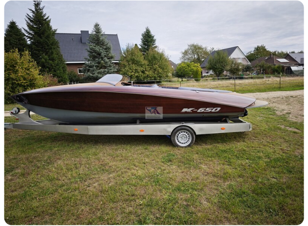
Kaiser 650 Super Sport 1