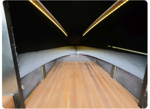
Kaiser 650 Super Sport 3