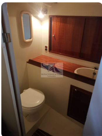
Kiel Legend 28 21