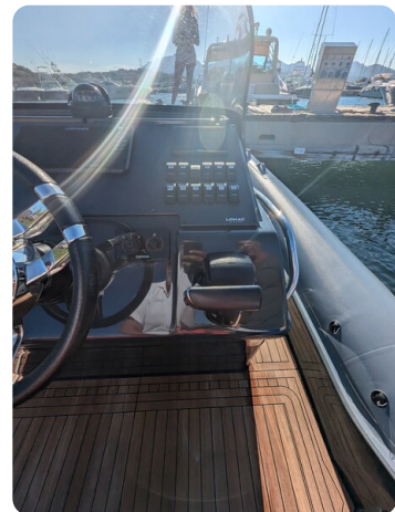
Lomac Adrenalina 7.5 console