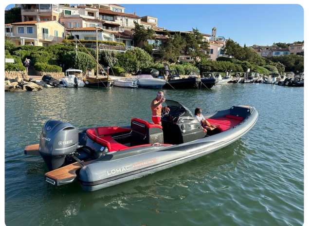
Lomac 7.50 Adrenalina aft view