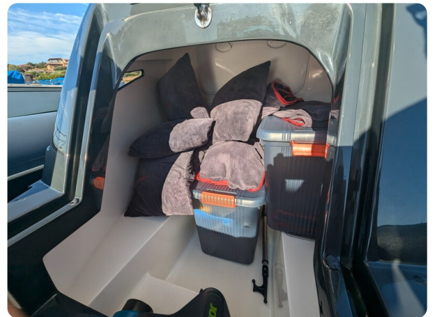
Lomac Adrenalina 7.5 storage console