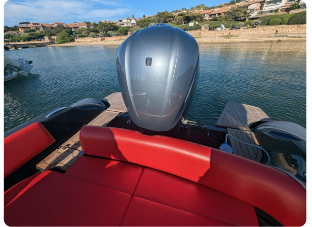
Lomac Adrenalina 7.5 stern view