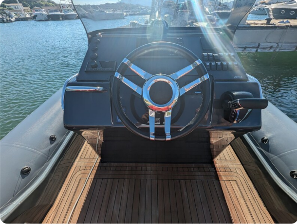
Lomac Adrenalina 7.5 helm