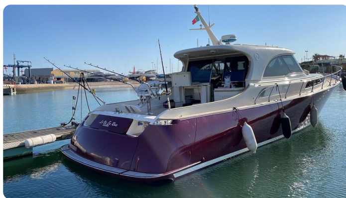
Dolphin 51 aft profile