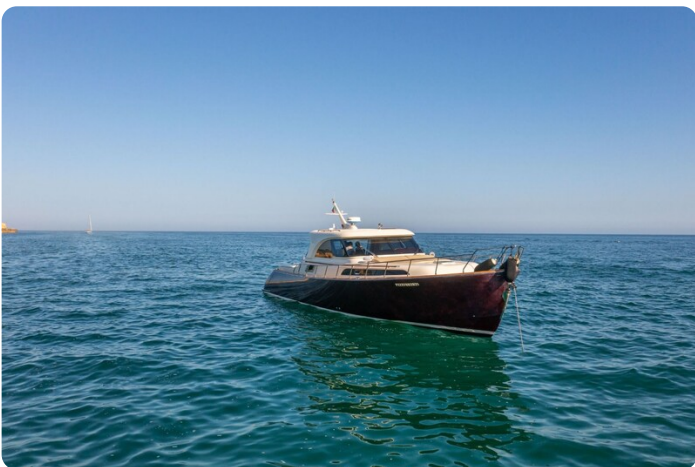
Dolphin 51 bow view