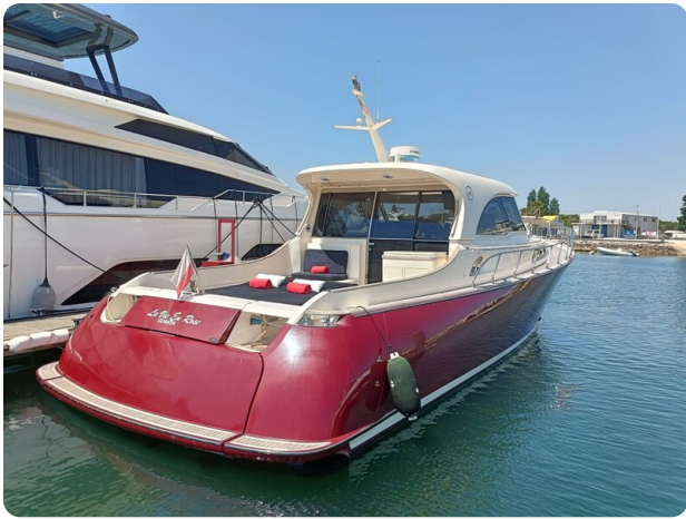
Dolphin 51 aft view