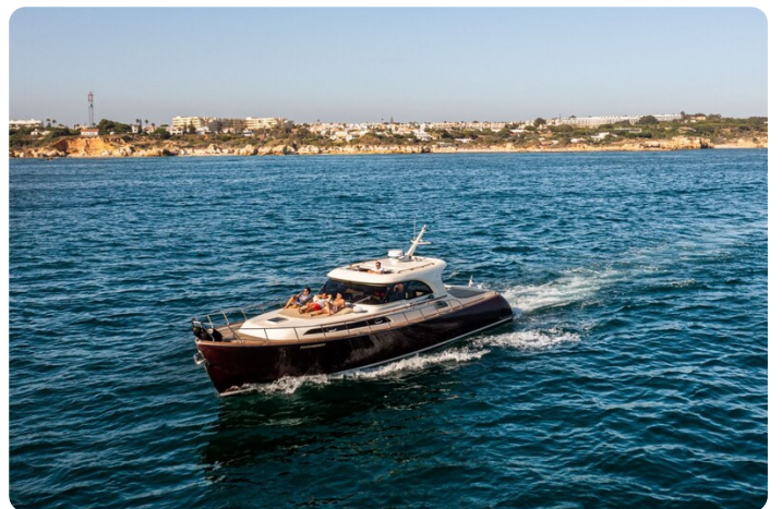
Dolphin 51 cruising