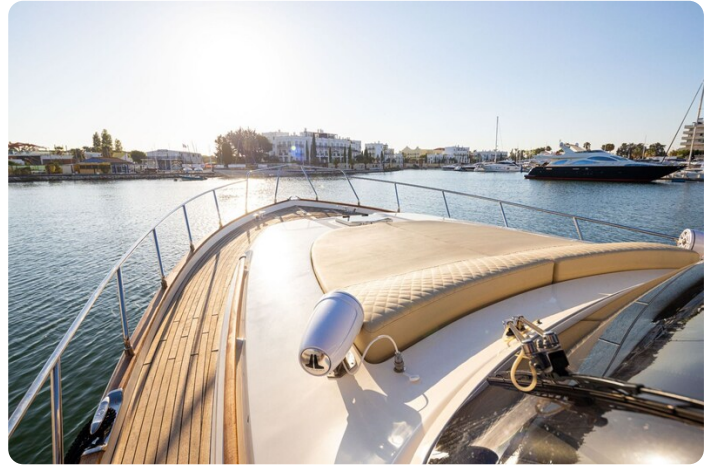
Dolphin 51 bow deck