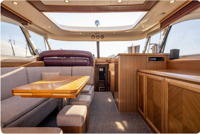
Dolphin 51 salon