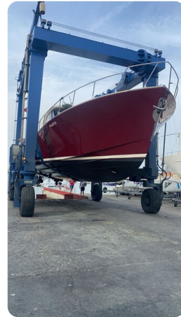
Dolphin 51 drydock