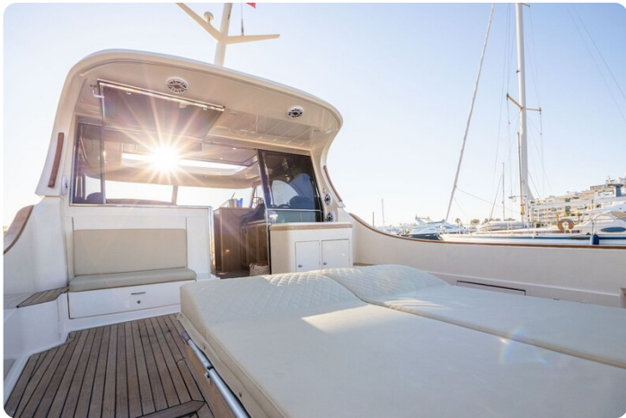
Dolphin 51 cockpit detail