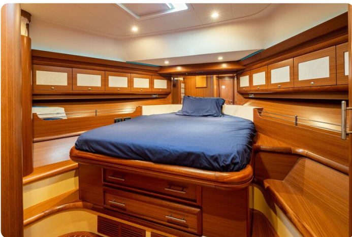
Dolphin 51 Vip cabin