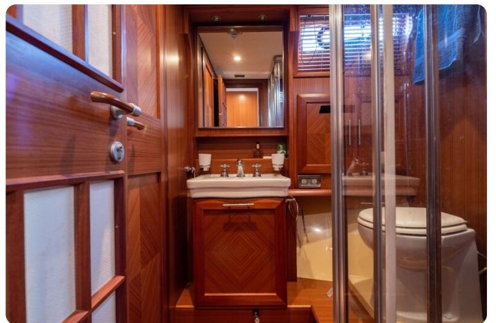
Dolphin 51 bathroom