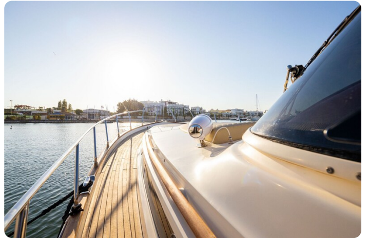
Dolphin 51 sideways