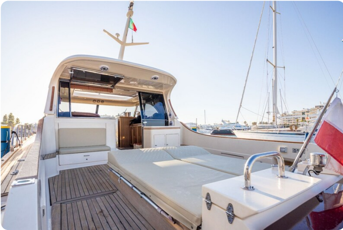
Dolphin 51 cockpit