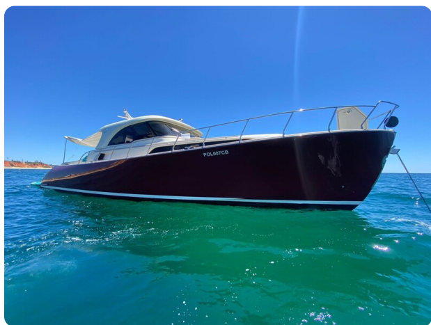
Dolphin 51 bow profile