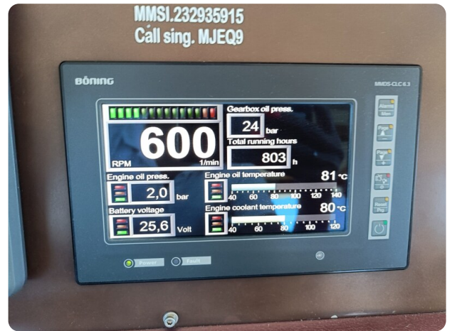
Dolphin 51 engine hours 29-08-24