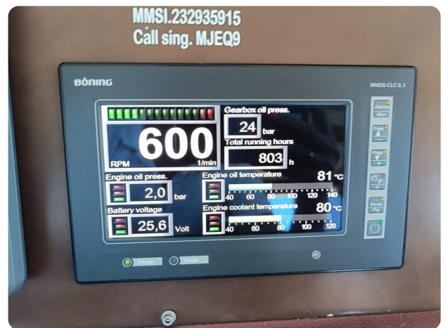
Dolphin 51 engine hours 29-08-24