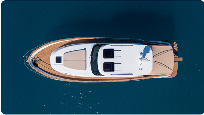
Copy of Top