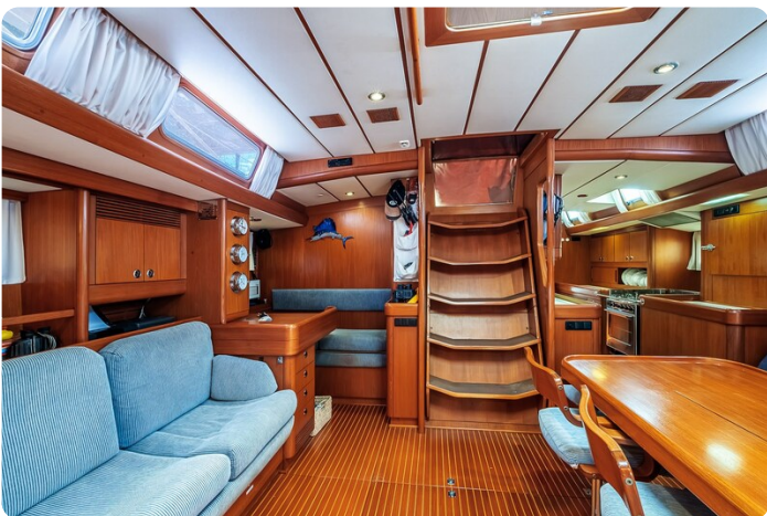
Indigo - Palma -46