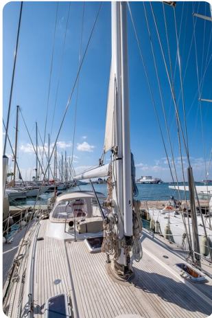
Indigo - Palma -6