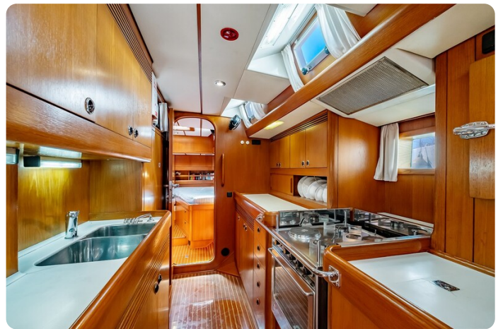
Indigo - Palma -36