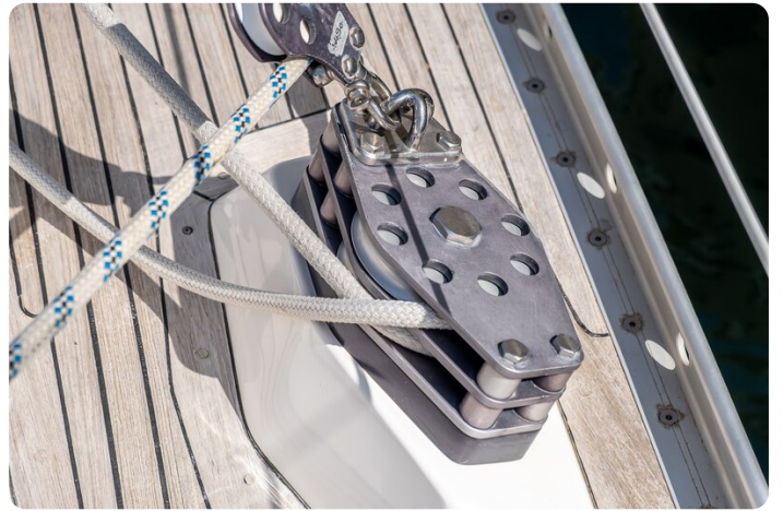
Indigo - Palma -16