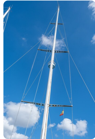
Indigo - Palma -17