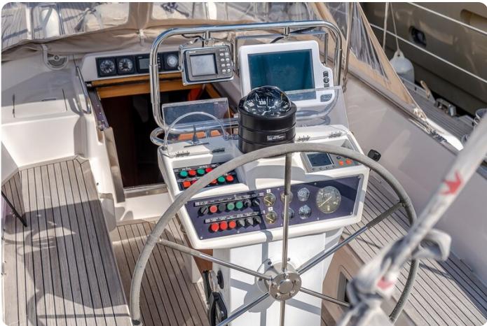
Indigo - Palma -12