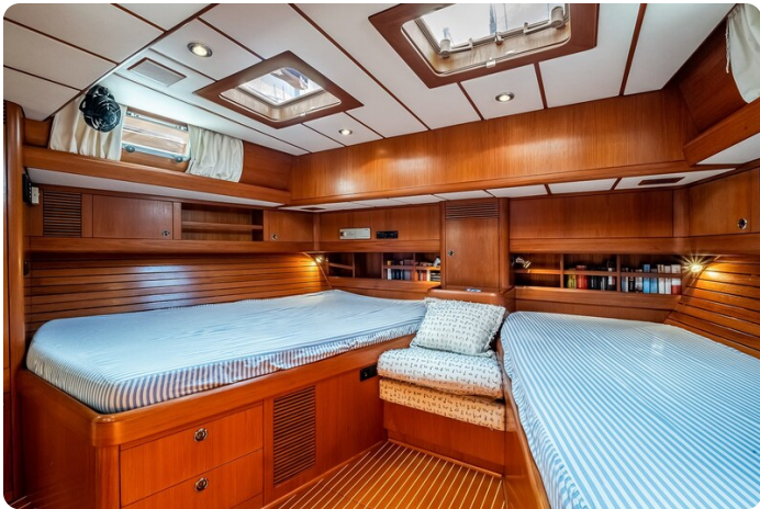
Indigo - Palma -31