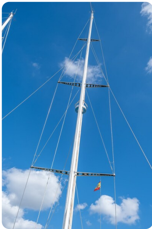
Indigo - Palma -17