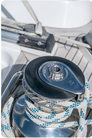
Indigo - Palma -15