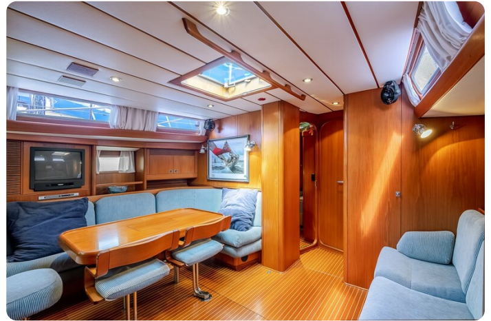
Indigo - Palma -44