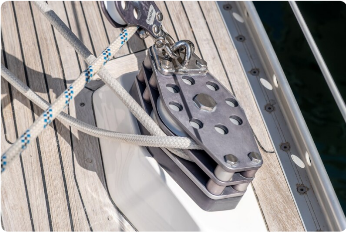
Indigo - Palma -16