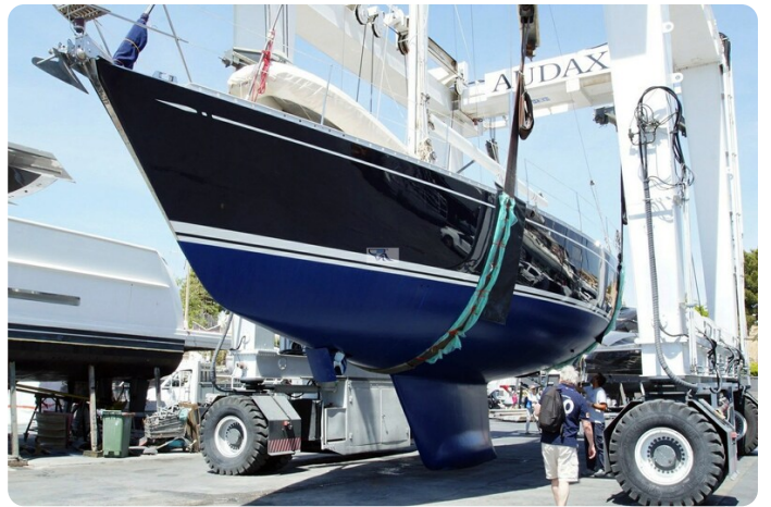
Swan 57 INDIGO 104