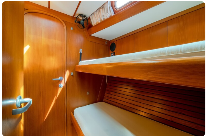
Indigo - Palma -27