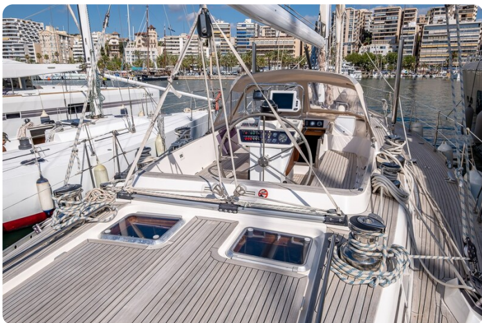
Indigo - Palma -2