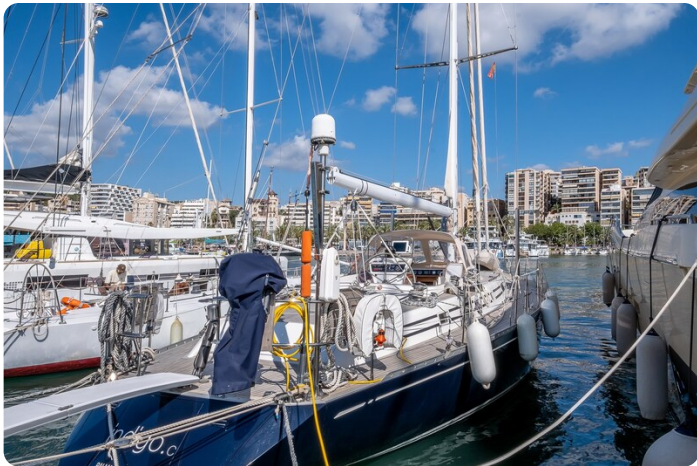
Indigo - Palma -10