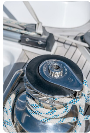
Indigo - Palma -15