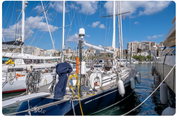
Indigo - Palma -10