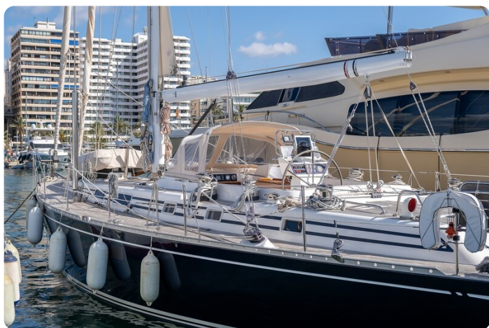
Indigo - Palma -20