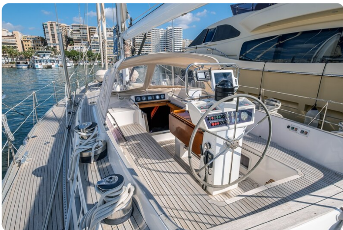
Indigo - Palma -4