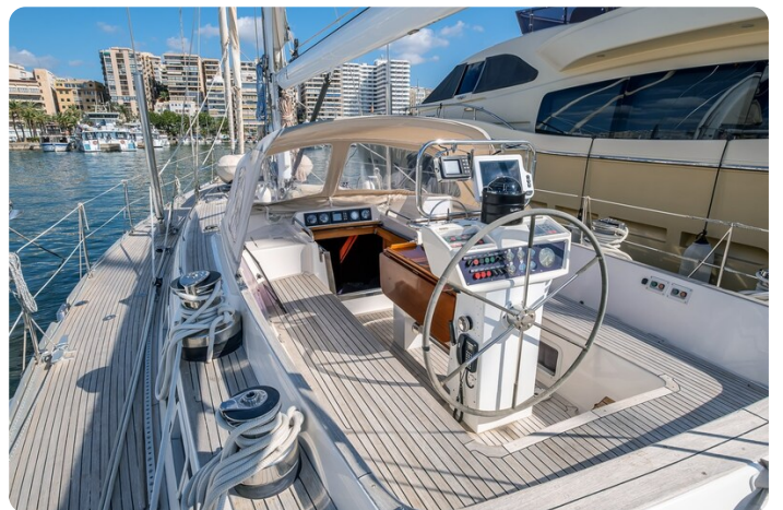
Indigo - Palma -4