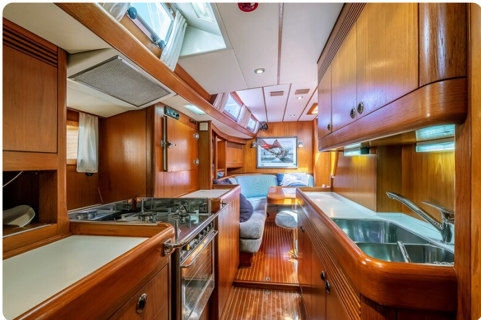
Indigo - Palma -40