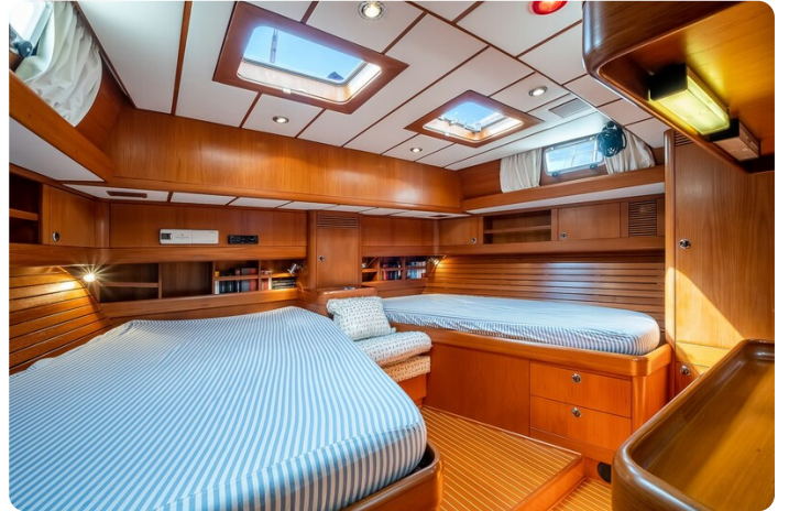
Indigo - Palma -34