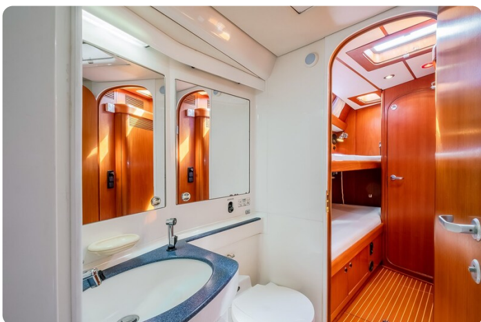
Indigo - Palma -28