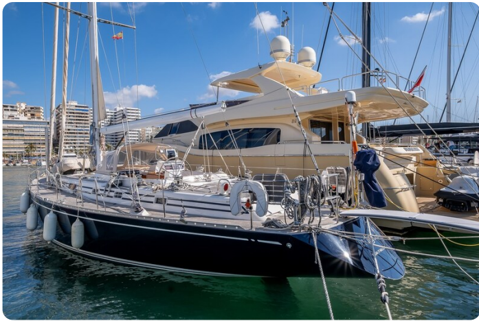
Indigo - Palma -8