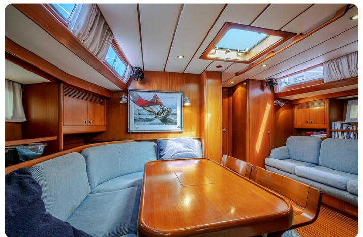
Indigo - Palma -42