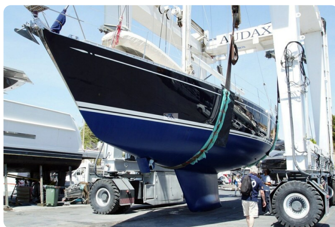
Swan 57 INDIGO 104