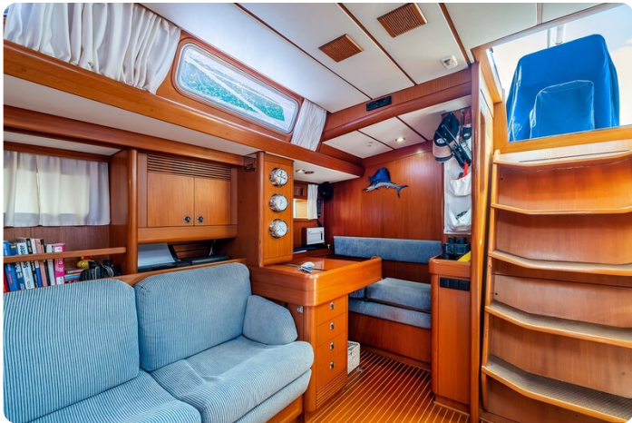
Indigo - Palma -38