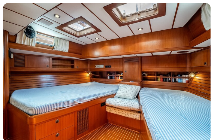
Indigo - Palma -31