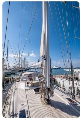
Indigo - Palma -6