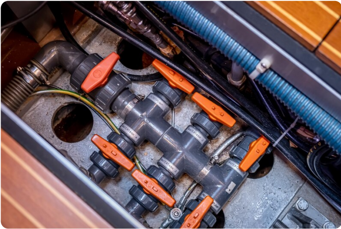
Indigo - Palma -48