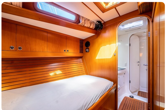
Indigo - Palma -30