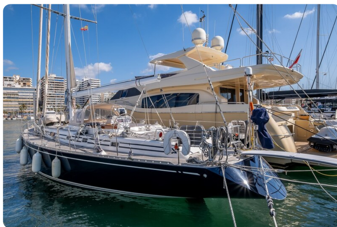
Indigo - Palma -8