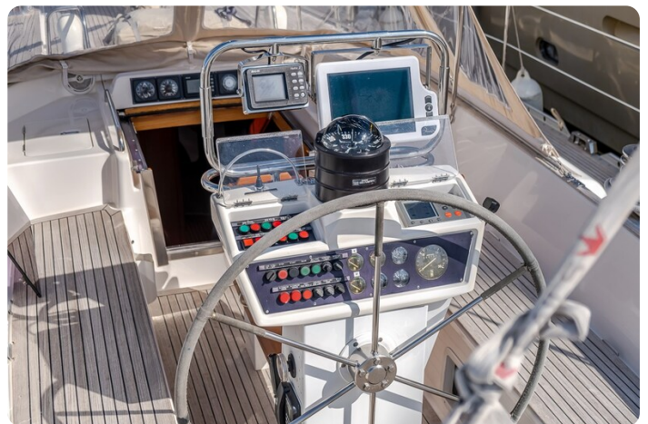
Indigo - Palma -12