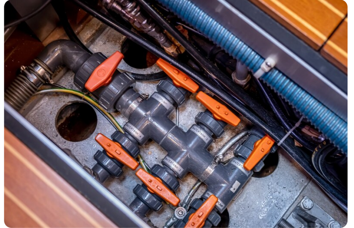
Indigo - Palma -48