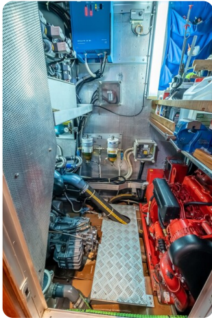
Indigo - Palma -35