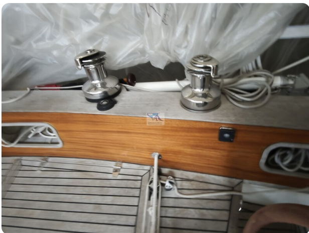
Nordborg 40 33