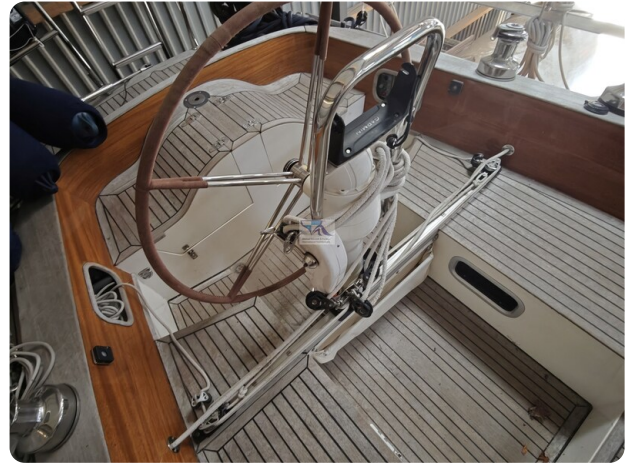
Nordborg 40 30