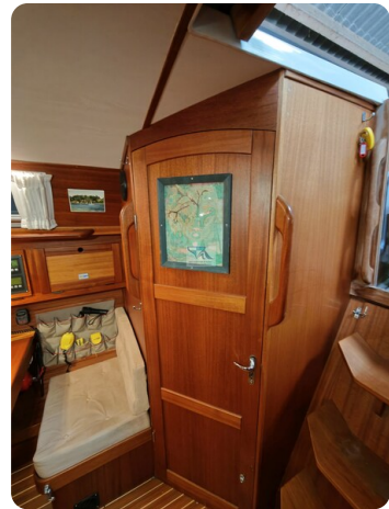
Nordborg 40 56