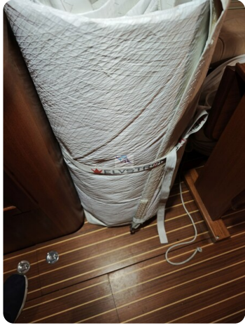
Nordborg 40 39