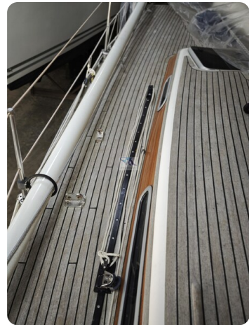
Nordborg 40 16