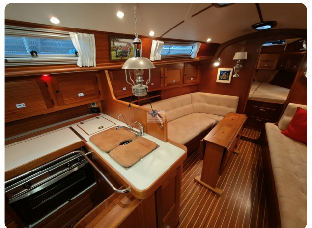
Nordborg 40 52