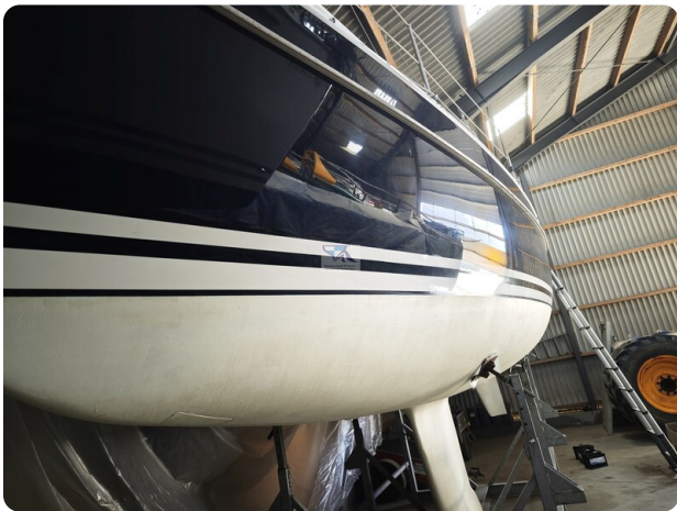
Nordborg 40 2