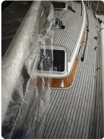
Nordborg 40 23