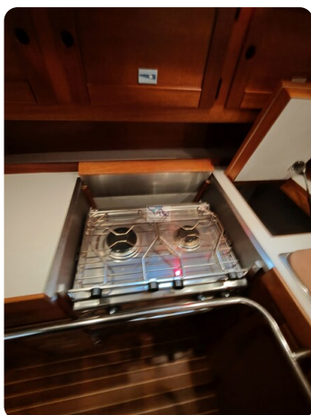
Nordborg 40 59