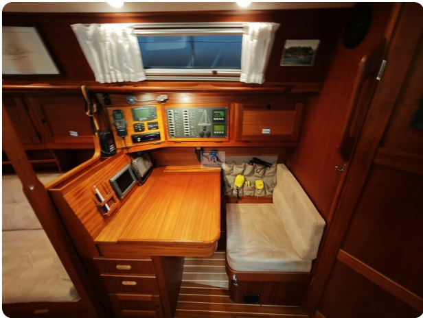
Nordborg 40 55