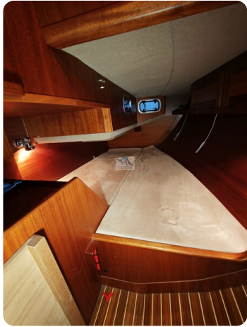
Nordborg 40 68