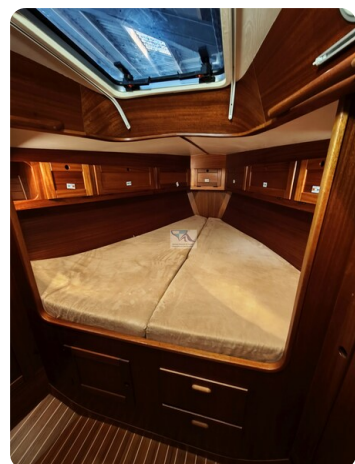
Nordborg 40 43