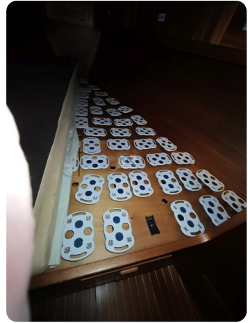
Nordborg 40 66