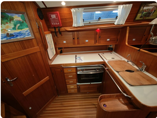
Nordborg 40 50