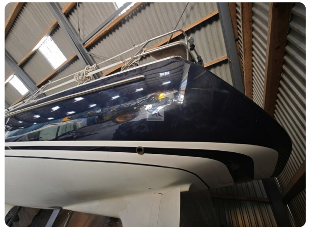
Nordborg 40 11