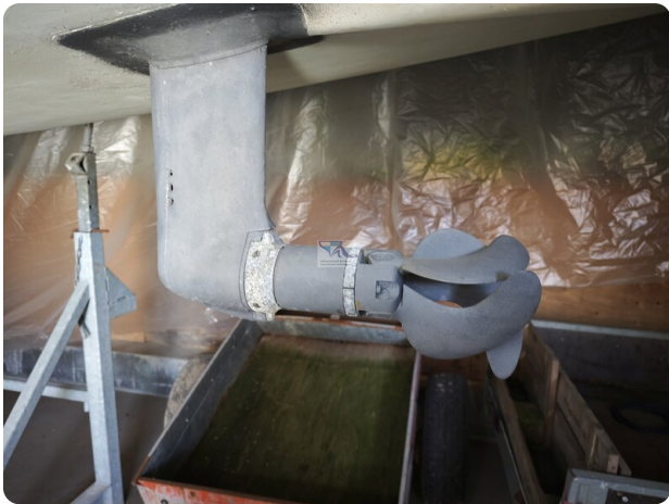
Nordborg 40 12