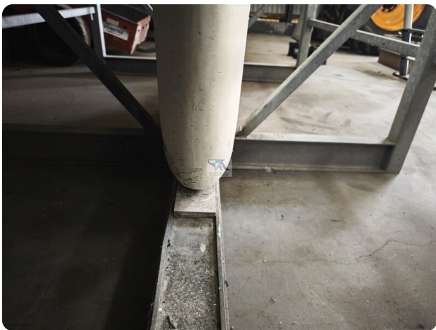
Nordborg 40 5