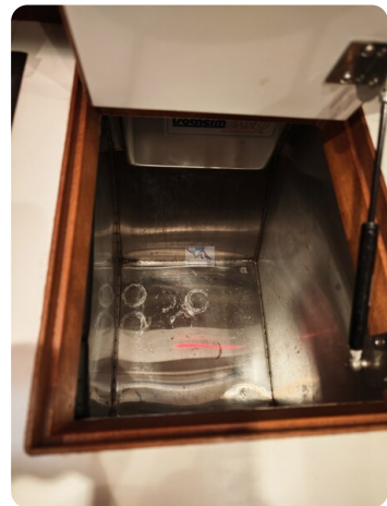
Nordborg 40 57