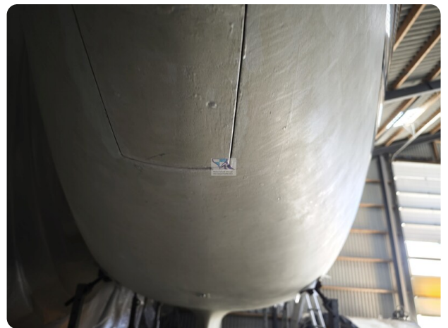
Nordborg 40 4