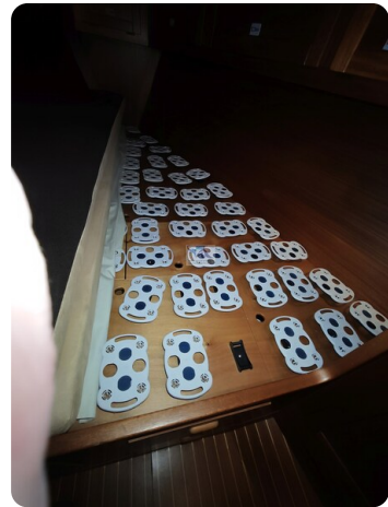
Nordborg 40 66