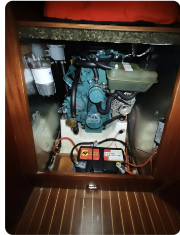
Nordborg 40 61