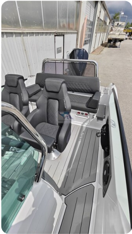
Nordkapp 705 29