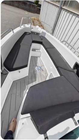
Nordkapp 705 20