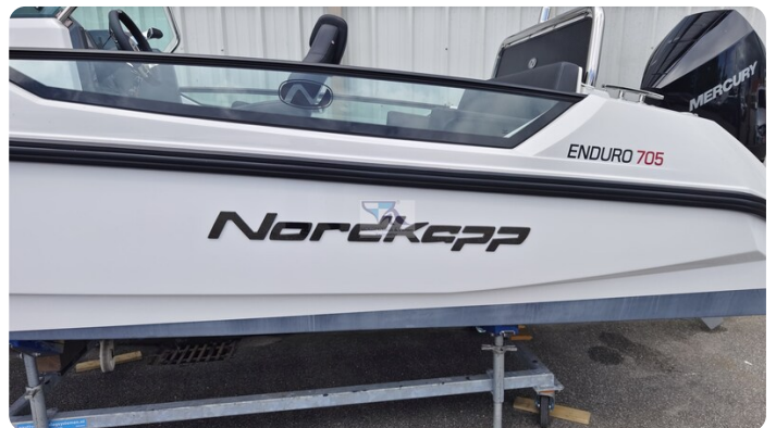
Nordkapp 705 51