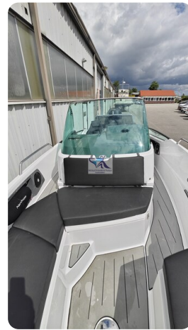
Nordkapp 705 13