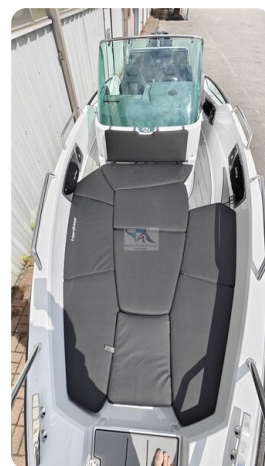
Nordkapp 705 18