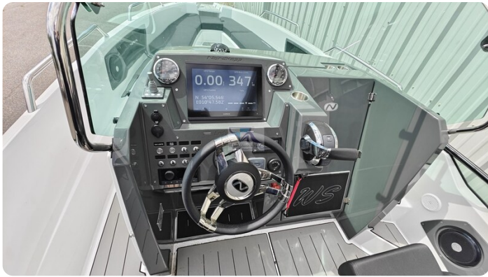
Nordkapp 705 34