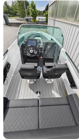
Nordkapp 705 33