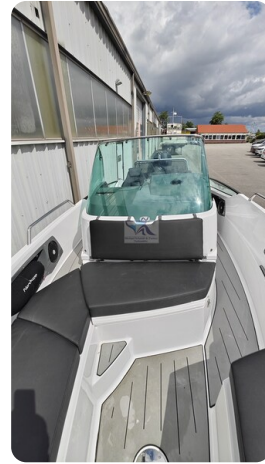
Nordkapp 705 22