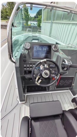
Nordkapp 705 36