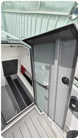
Nordkapp 705 44