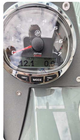
Nordkapp 705 41