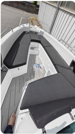
Nordkapp 705 11