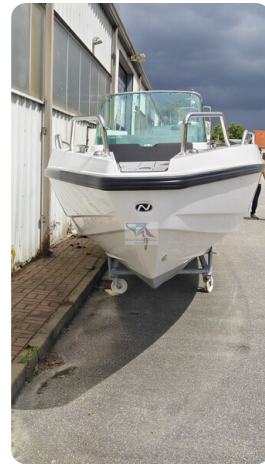
Nordkapp 705 54