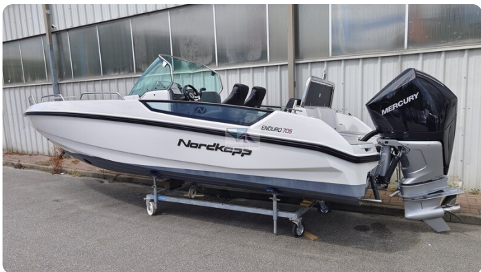
Nordkapp 705 50