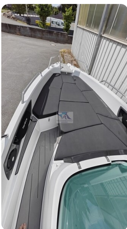
Nordkapp 705 16