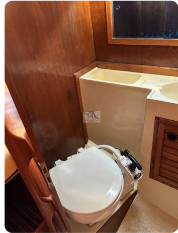
Avance 36 dL msp21