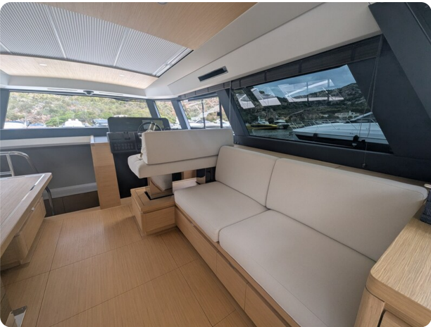
{1} Salon lounge