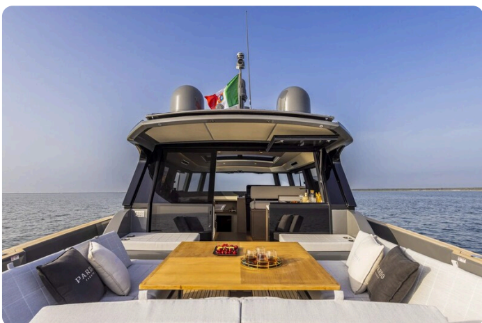
Pardo GT52 cockpit view