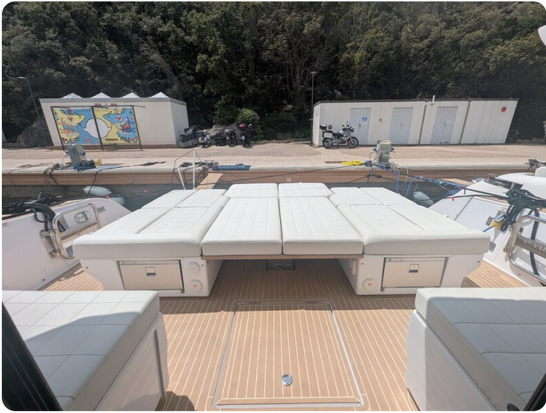
Pardo GT52 aft sunpad