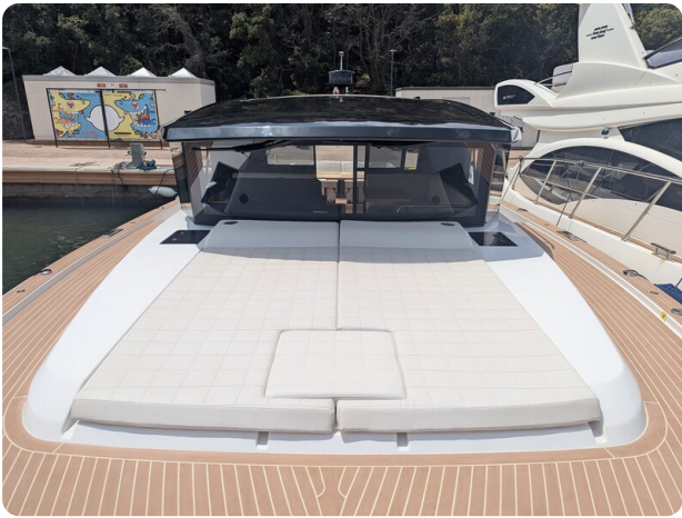
Pardo GT52 fwd deck with sunpad