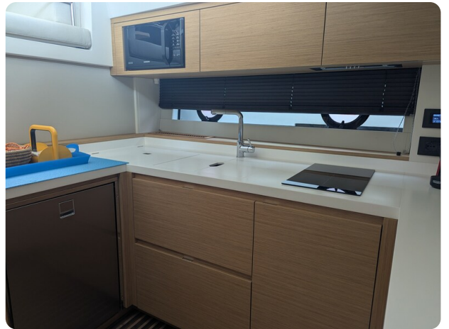
{1} Galley detail