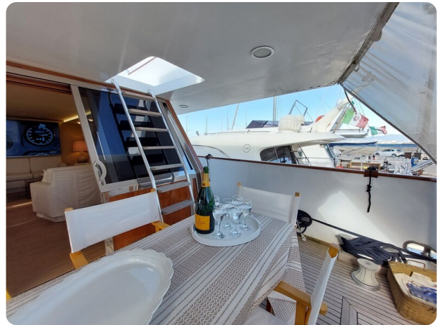
Picchiotti 68, Cabanon, esterno