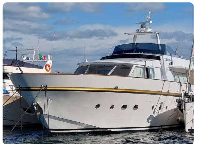
Picchiotti 68, Cabanon, vista al mascone