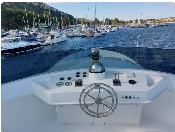
Picchiotti 68, Cabanon, flybridge postazione di guida