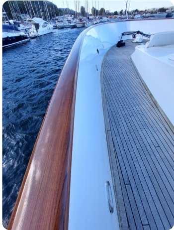
Picchiotti 68, Cabanon, dettagli teak e falchetta