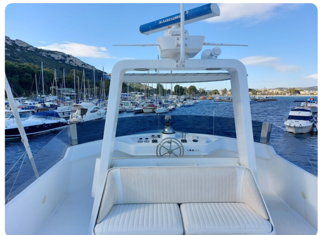
Picchiotti 68, Cabanon, flybridge dettaglio