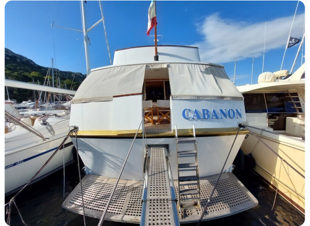
Picchiotti 68, Cabanon poppa2