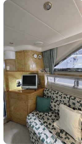
Princess 420 ARNO 5