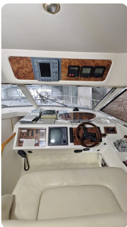
Princess 420 ARNO 6