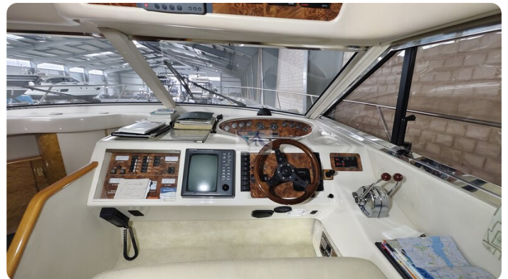
Princess 420 ARNO 8