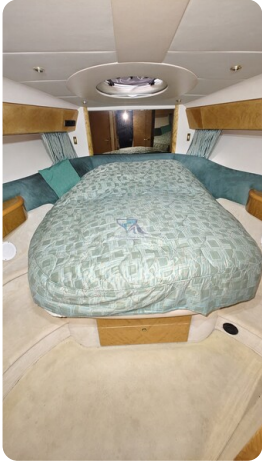
Princess 420 ARNO 15