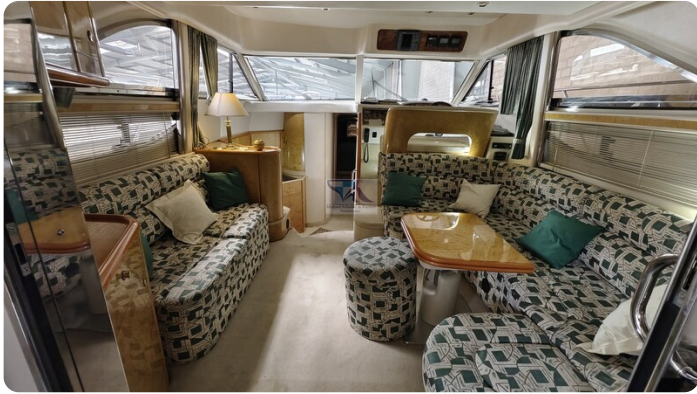
Princess 420 ARNO 1