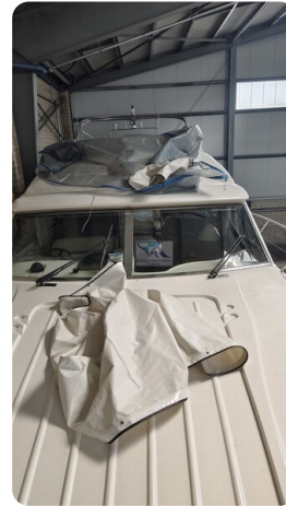
Princess 420 ARNO 49