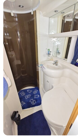
Princess 420 ARNO 18