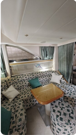
Princess 420 ARNO 4