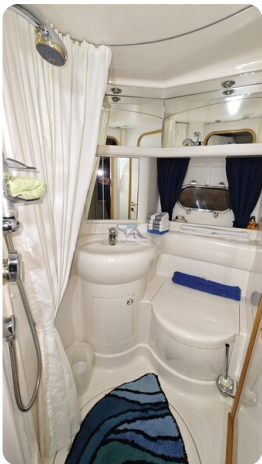
Princess 420 ARNO 20