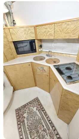
Princess 420 ARNO 25