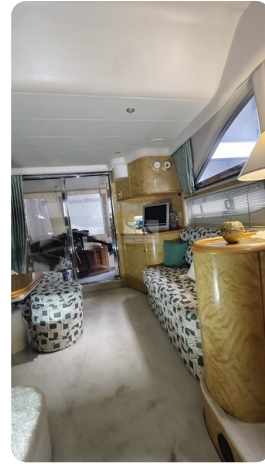
Princess 420 ARNO 13