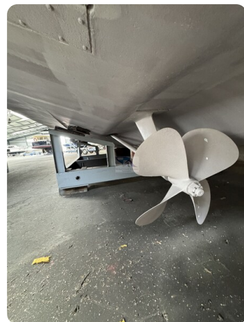
Princess 420 ARCOS 45