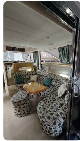
Princess 420 ARNO 3