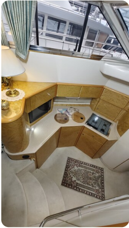
Princess 420 ARNO 11