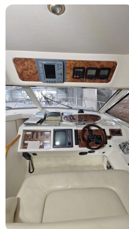
Princess 420 ARNO 6