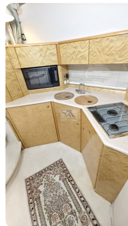
Princess 420 ARNO 25