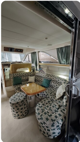
Princess 420 ARNO 3