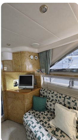
Princess 420 ARNO 5