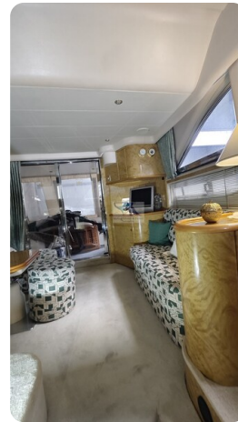
Princess 420 ARNO 13