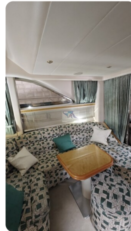
Princess 420 ARNO 4