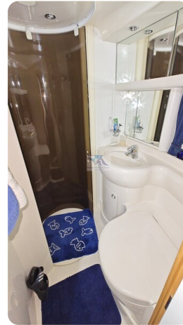
Princess 420 ARNO 18