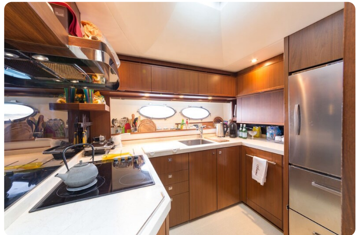
Princess V78 galley