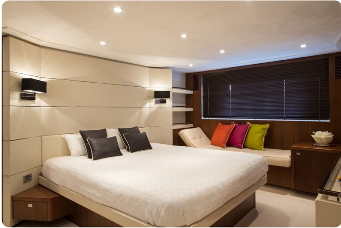
Princess V78 cabin detail