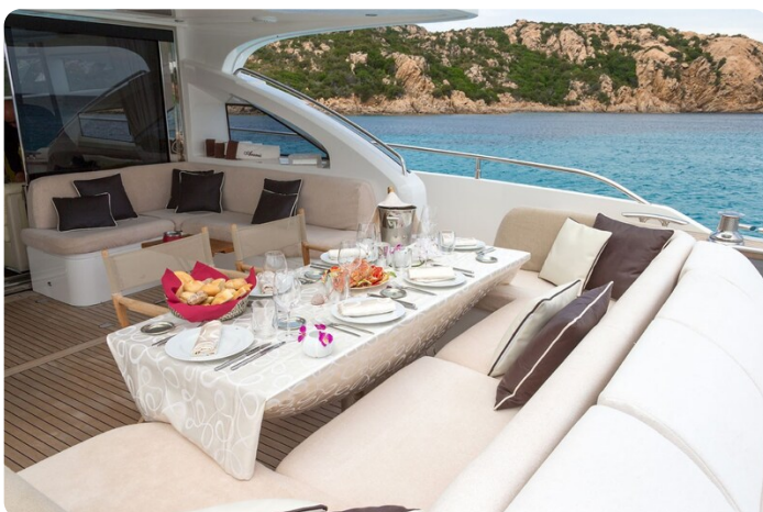
Princess V78 cockpit