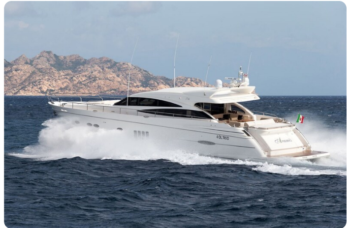
Princess V78 running