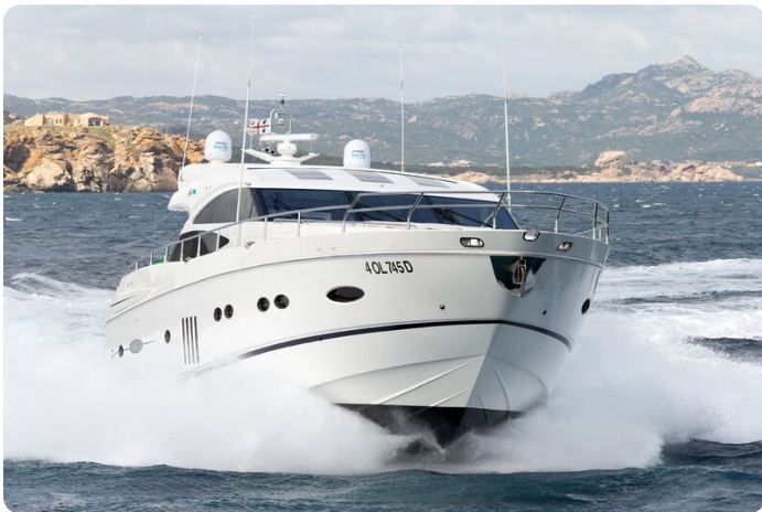
Princess V78 bow