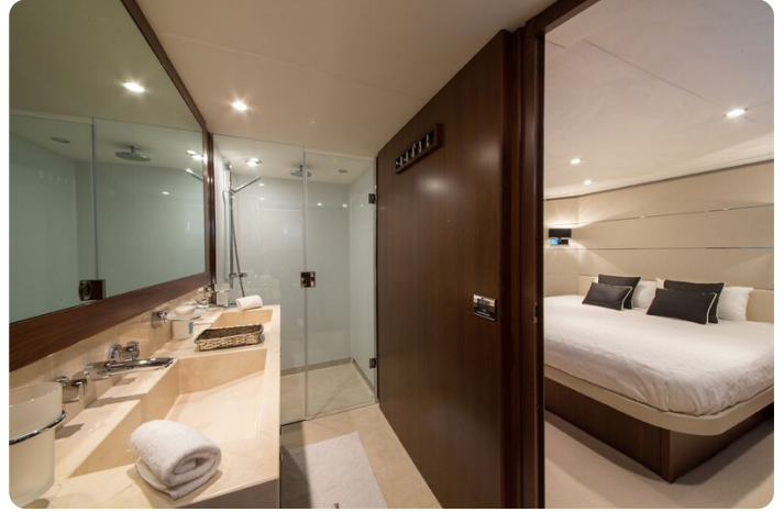
Princess V78 owner's bathroom