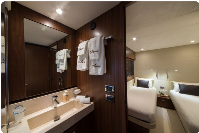
Princess V78 guest bathroom