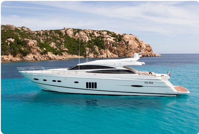
Princess V78 profile