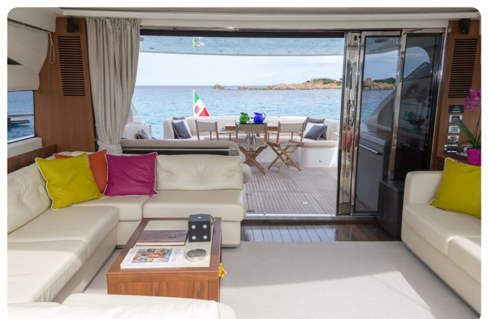
Princess V78 salon to aft