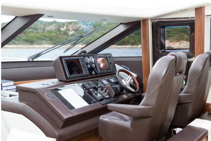
Princess V78 helm station