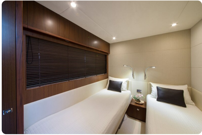
Princess V78 guest cabin twin