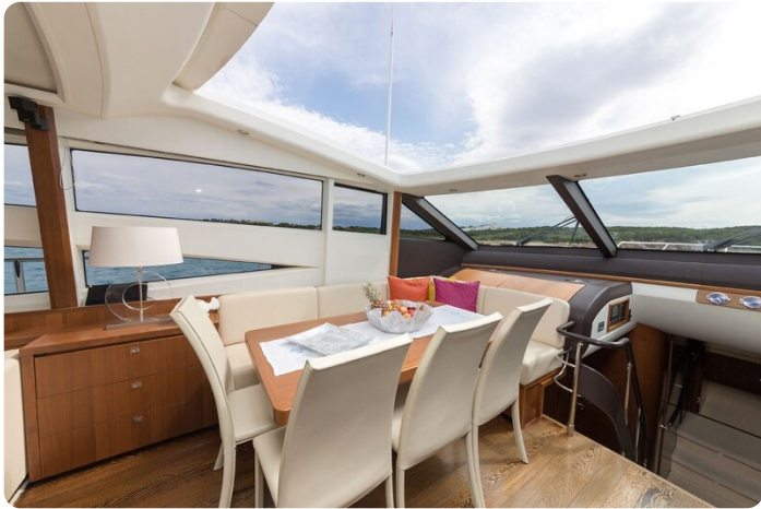
Princess V78 dining area detail