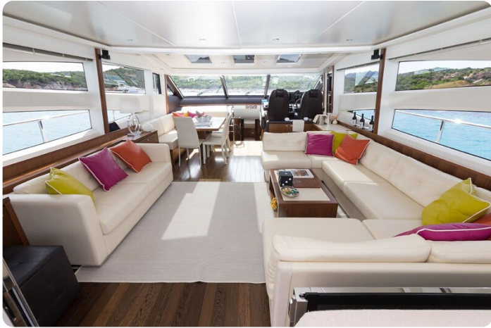
Princess V78 salon