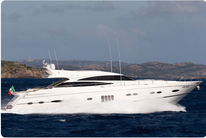
Princess V78 cruising