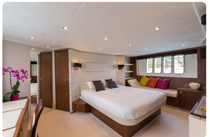
Princess V78 owner's cabin