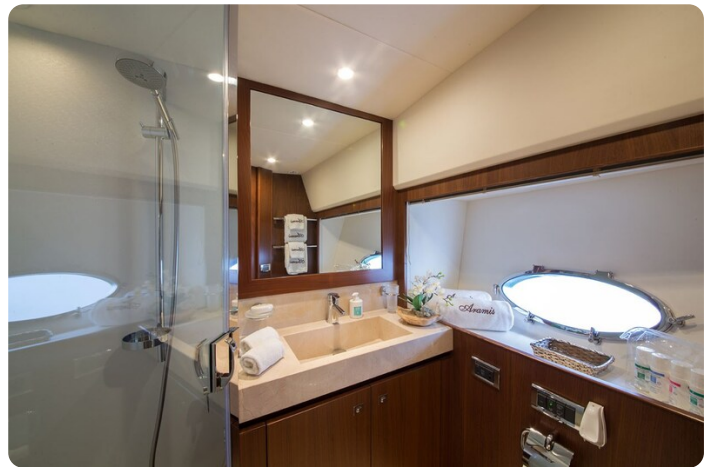
Princess V78 Vip bathroom