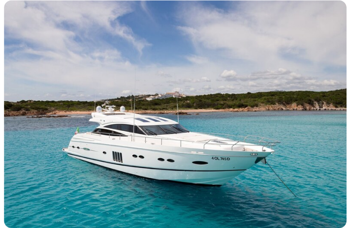
Princess V78 bow profile