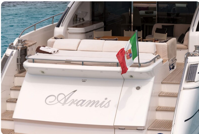
Princess V78 stern view