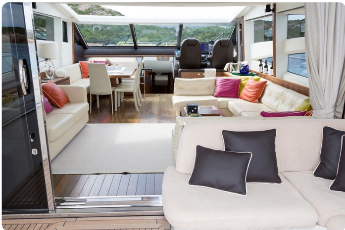
Princess V78 dinette