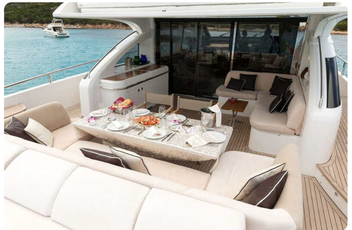
Princess V78 cockpit view