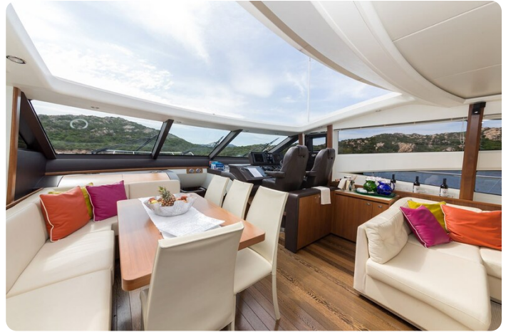
Princess V78 dining area