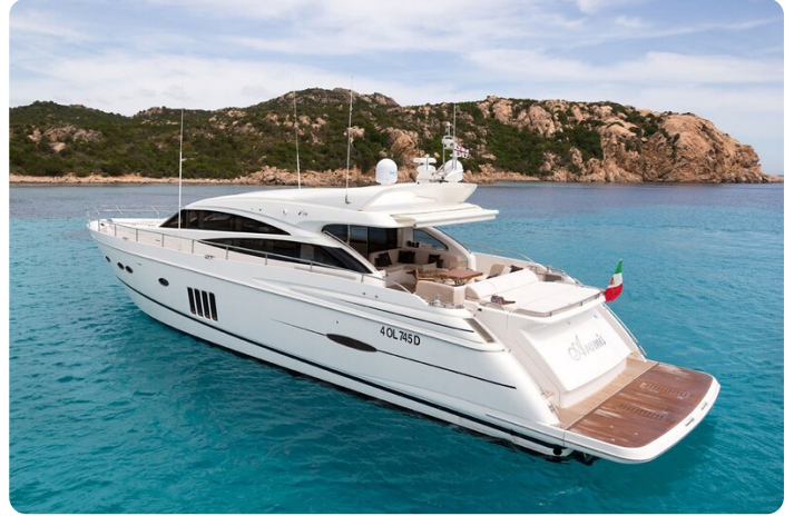
Princess V78 aft profile