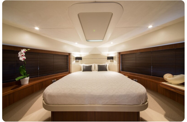
Princess V78 Vip cabin