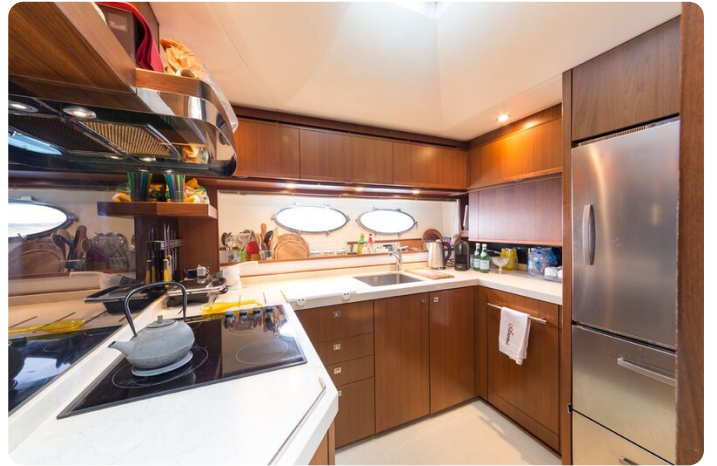
Princess V78 galley