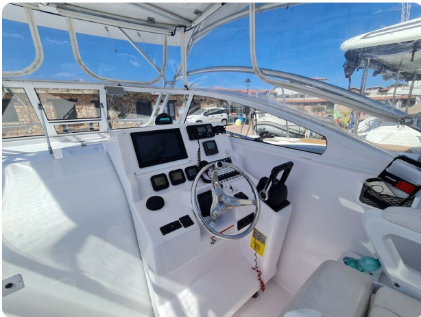
Proline 32 Express, helm station