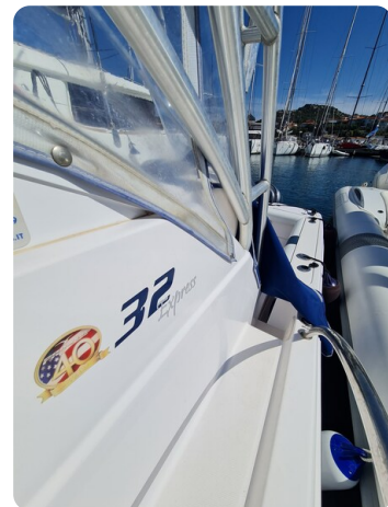
Proline 32 Express, side view