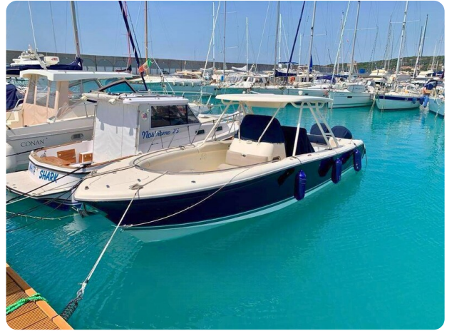
Pursuit 310 Sport Fwd Port Profile