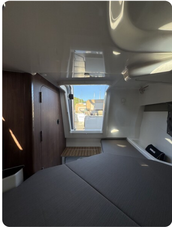
Quicksilver Activ 755 Cruiser ENNA 12