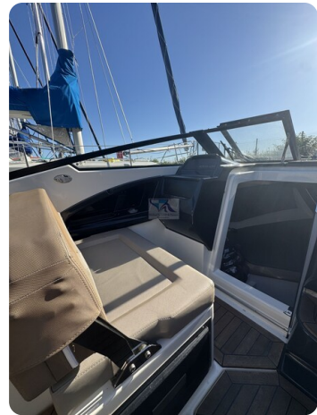
Quicksilver Activ 755 Cruiser ENNA 41