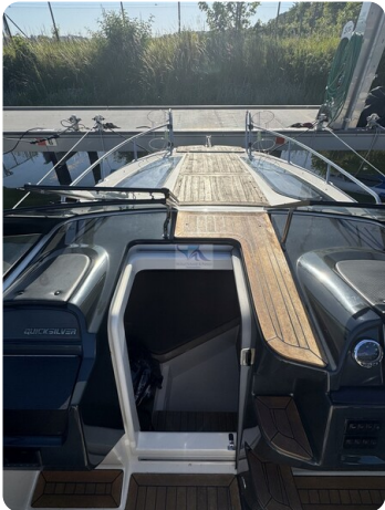
Quicksilver Activ 755 Cruiser ENNA 25