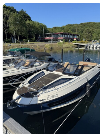
Quicksilver Activ 755 Cruiser ENNA 1