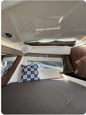
Quicksilver Activ 755 Cruiser ENNA 8