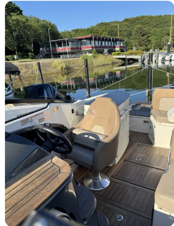
Quicksilver Activ 755 Cruiser ENNA 23