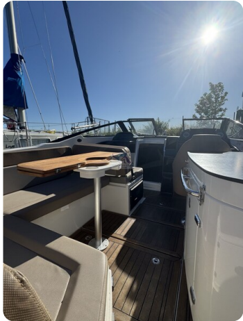
Quicksilver Activ 755 Cruiser ENNA 44