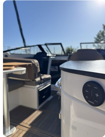
Quicksilver Activ 755 Cruiser ENNA 45