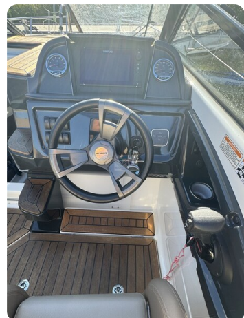
Quicksilver Activ 755 Cruiser ENNA 37