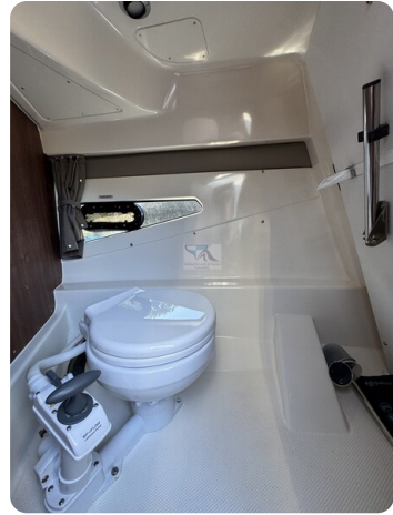
Quicksilver Activ 755 Cruiser ENNA 17