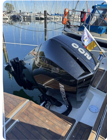
Quicksilver Activ 755 Cruiser ENNA 29