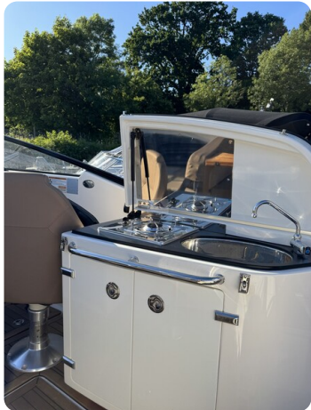
Quicksilver Activ 755 Cruiser ENNA 4