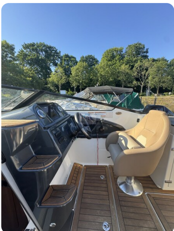
Quicksilver Activ 755 Cruiser ENNA 39