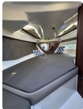
Quicksilver Activ 755 Cruiser ENNA 13