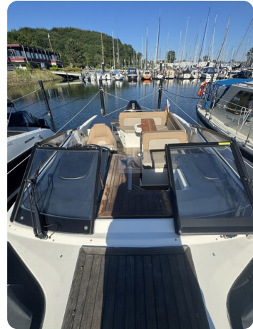
Quicksilver Activ 755 Cruiser ENNA 47