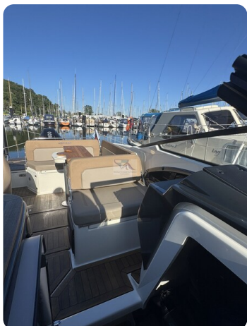
Quicksilver Activ 755 Cruiser ENNA 24