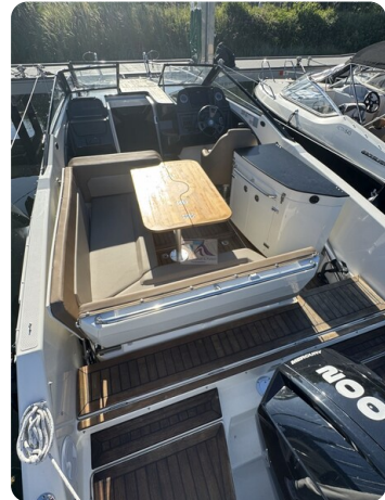
Quicksilver Activ 755 Cruiser ENNA 26