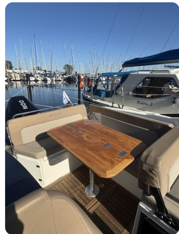
Quicksilver Activ 755 Cruiser ENNA 42