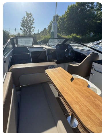
Quicksilver Activ 755 Cruiser ENNA 43