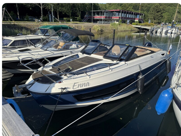
Quicksilver Activ 755 Cruiser ENNA 50