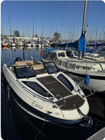
Quicksilver Activ 755 Cruiser ENNA 48