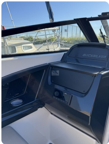
Quicksilver Activ 755 Cruiser ENNA 21