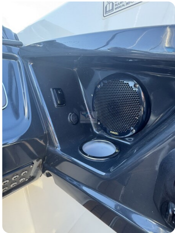
Quicksilver Activ 755 Cruiser ENNA 34