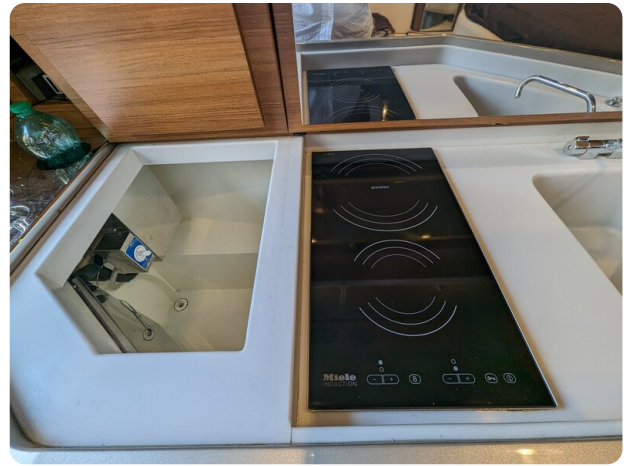
Rivarama galley detail