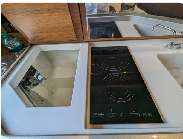
Rivarama galley detail