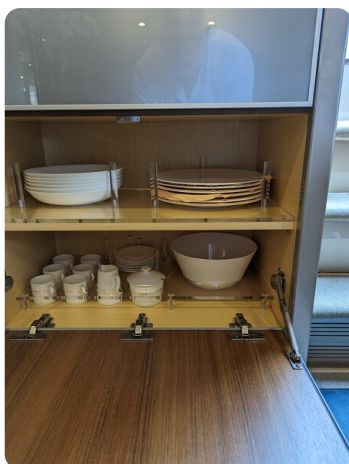
Rivarama Riva details