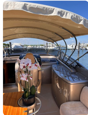
Rivarama cockpit detail