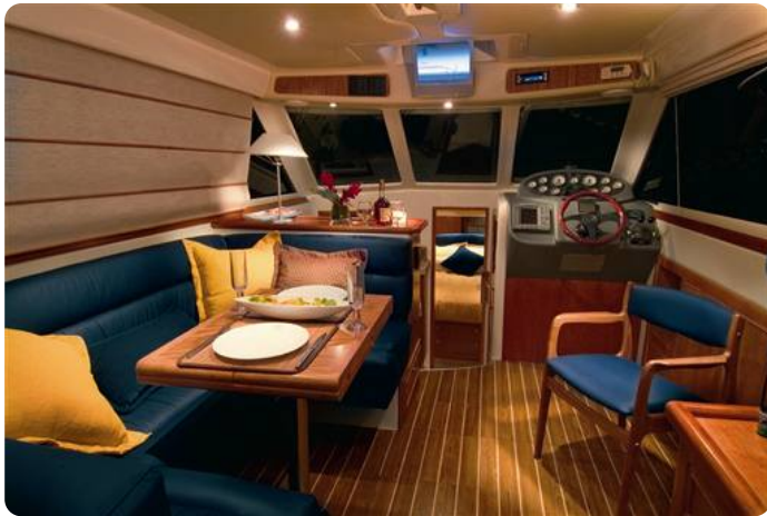
6Riviera 33 fly interior 1