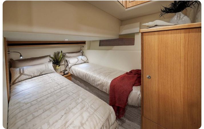
Riviera 45 Fly guest cabin, convertible