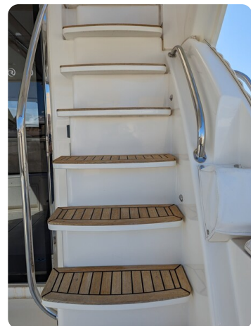
Riviera 45 Fly stairs