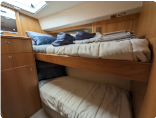
Riviera 45 Fly pullman berth cabin