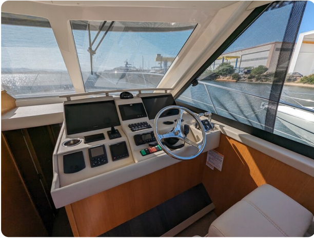
Riviera 45 Fly helm station detail