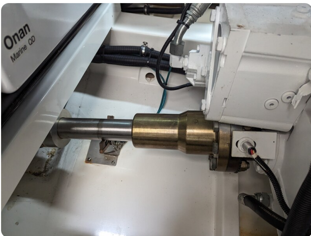
Riviera 45 Fly engine shaft detail