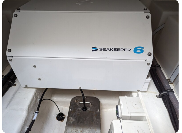
Riviera 45 Fly Seakeeper