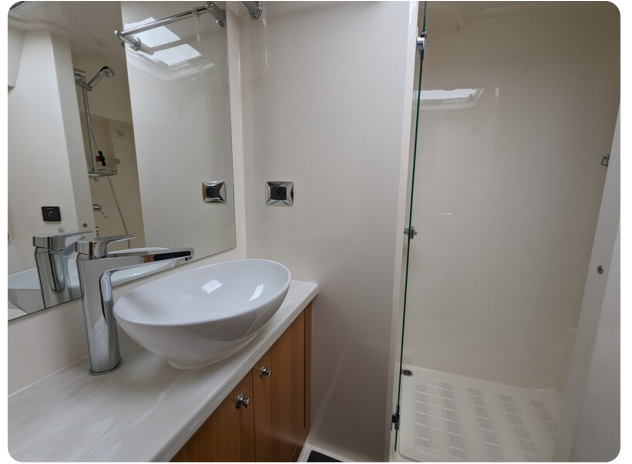
Riviera 45 Fly owner's bathroom