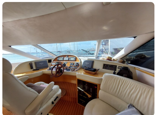
Rodman Yacht 64 Belisa, plancia comandi interno