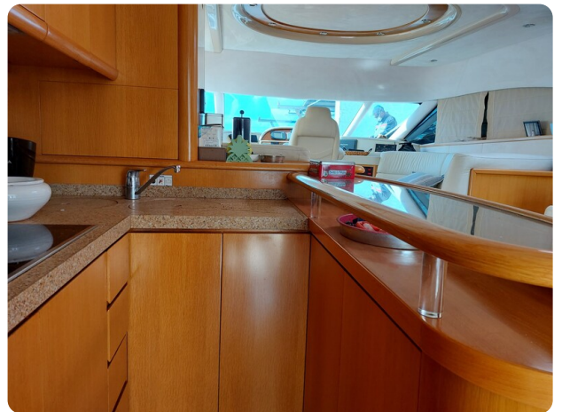
Rodman Yacht 64 Belisa, interno cucina