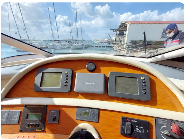
Rodman Yacht 64 Belisa, strumenti 1