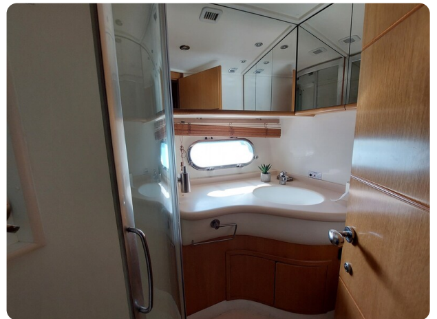
Rodman Yacht 64 Belisa, cabina vip bagno