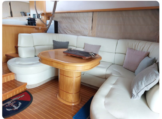
Rodman Yacht 64 Belisa, salone