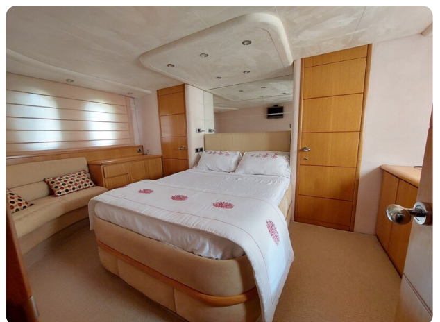
Rodman Yacht 64 Belisa, cabina armatorile 1