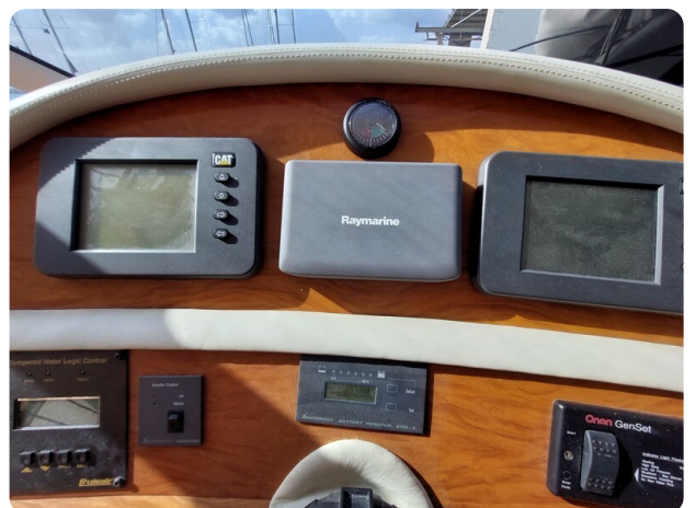
Rodman Yacht 64 Belisa, strumenti