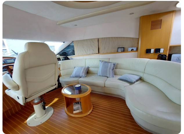
Rodman Yacht 64 Belisa, salone e guida