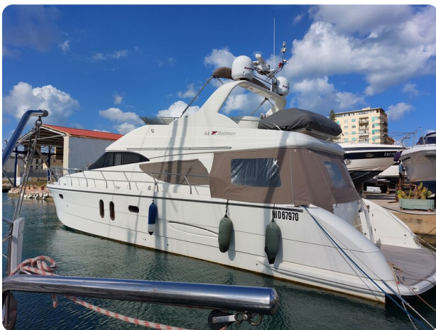
Rodman Yacht 64 Belisa, profile 1