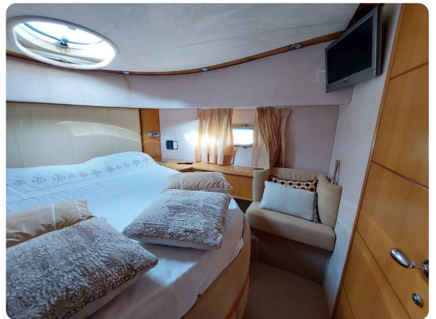
Rodman Yacht 64 Belisa cabina vip dettaglio