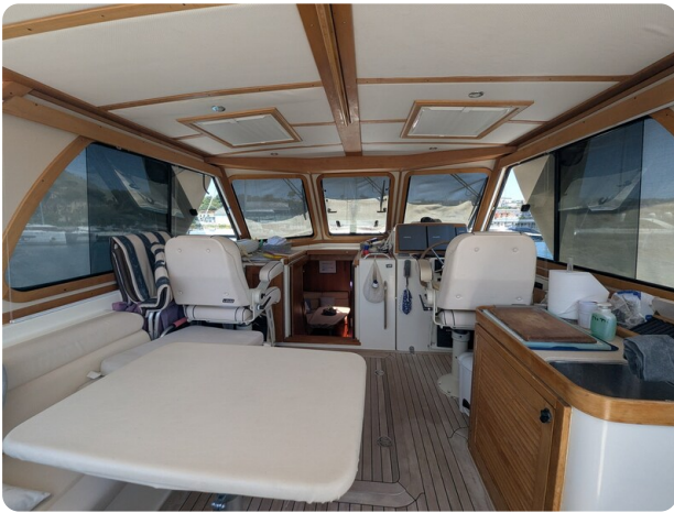
Sabre 42 Express upper cockpit view