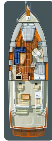
Sabre 42 layout