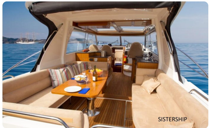
Saga 390 HT Sistership 2.jpg