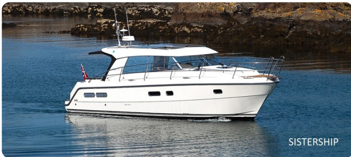
Saga 39 HT sistership