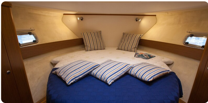
Saga 390 HT