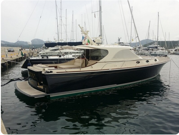
San Juan 48