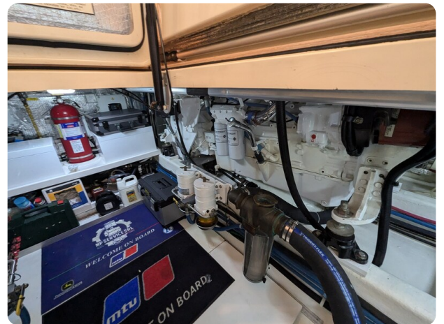
San Juan 48 engine room detail