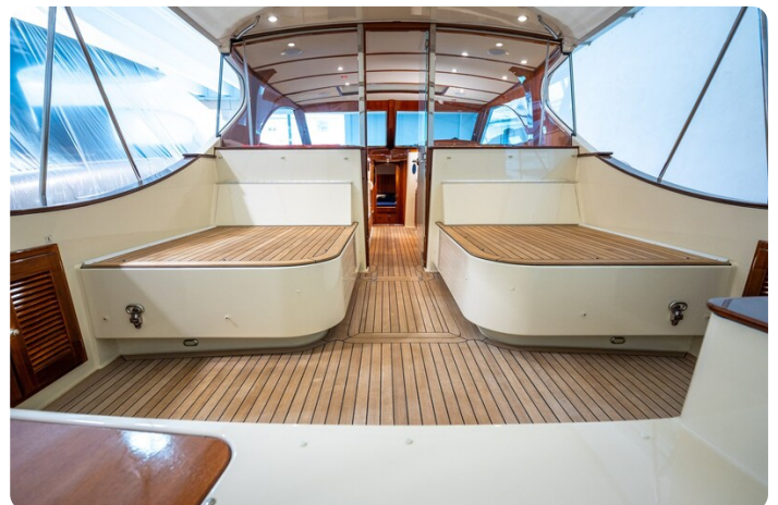
San Juan 48 cockpit