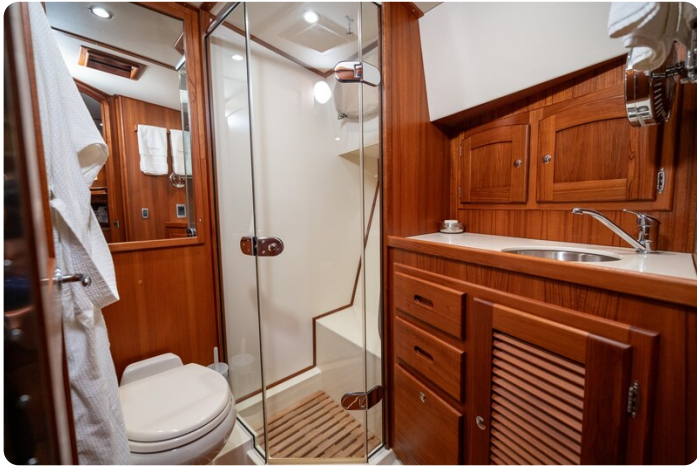
San Juan 48 owner's bathroom