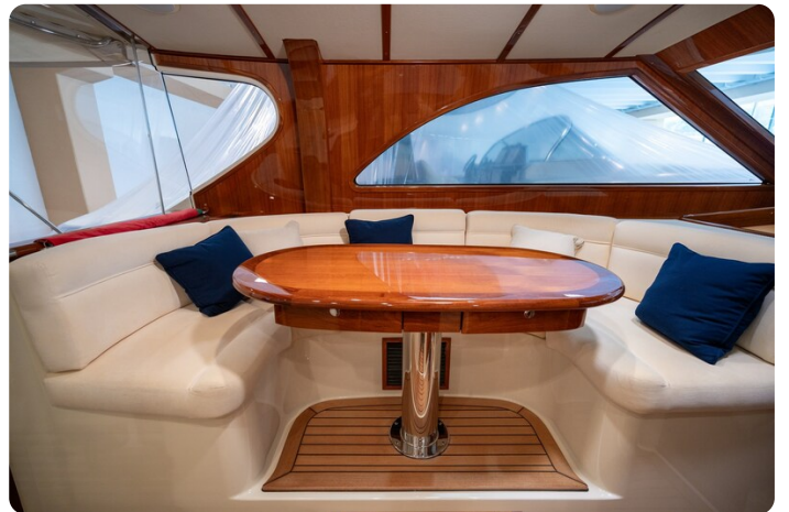
San Juan 48 dinette