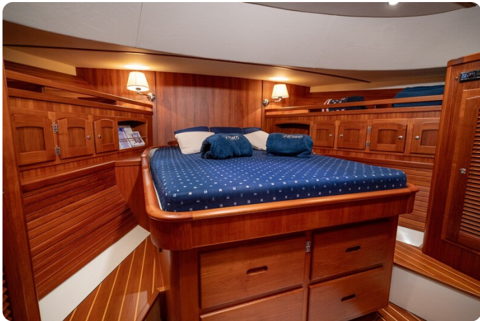
San Juan 48 Owner's cabin