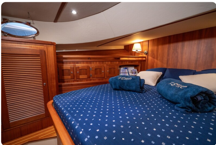
San Juan 48 owner's cabin detail