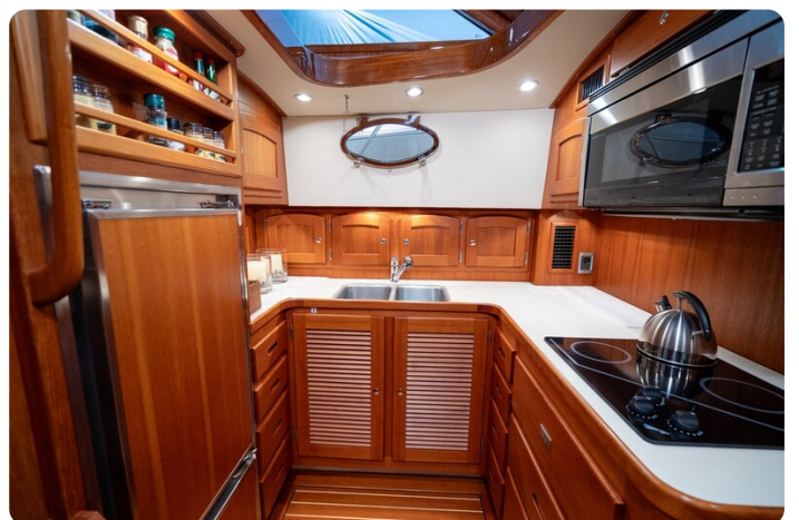
San Juan 48 galley