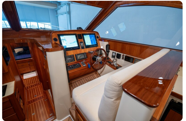
San Juan 48 Helm Station