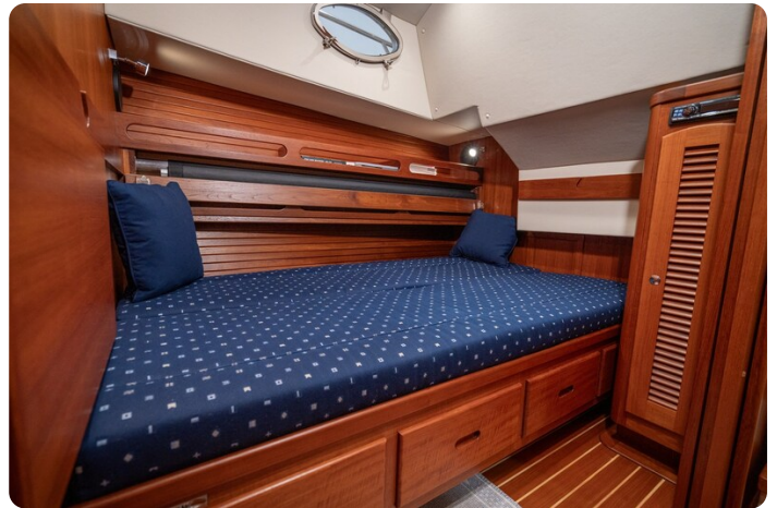
San Juan 48 guest cabin