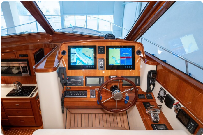
San Juan 48 Helm detail