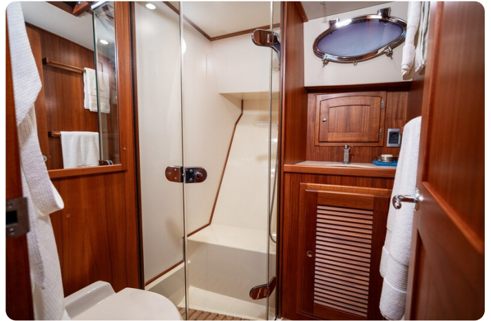
San Juan 48 Guest bathroom