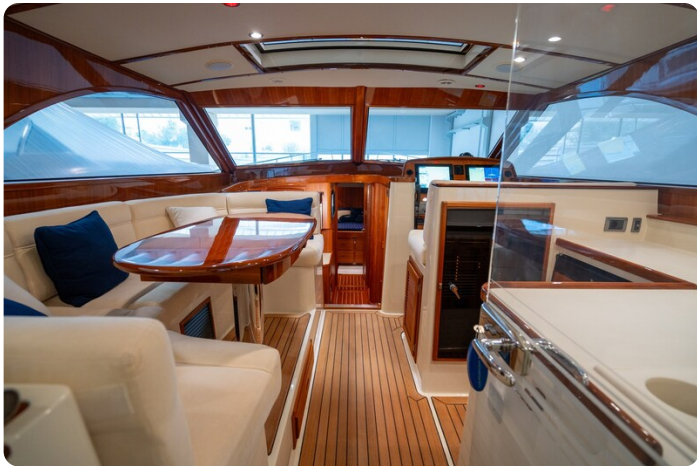
San Juan 48 Salon