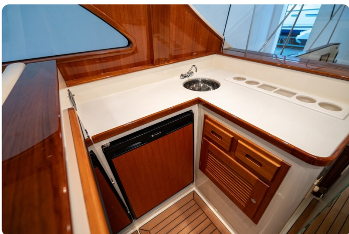
San Juan 48 upper bar