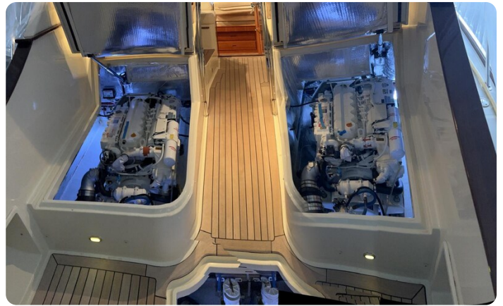
San Juan 40, engine room view