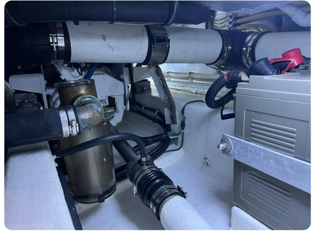
San Juan 40, engine room detail 2