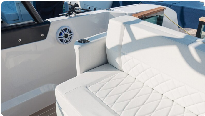
SAXDOR 270 GTO Sofa