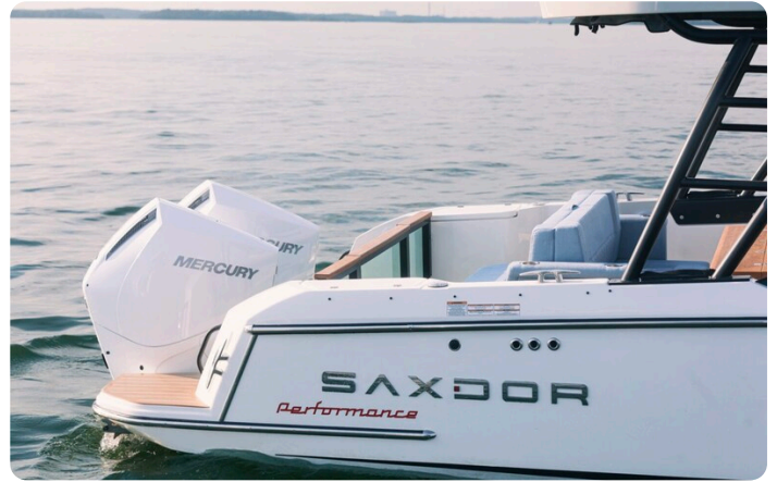
SAXDOR 270 GTO Stern view