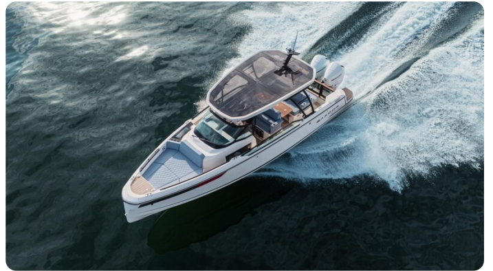
SAXDOR 270 GTO Cruising