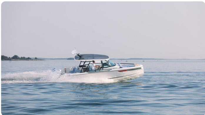
SAXDOR 270 GTO Profile cruising