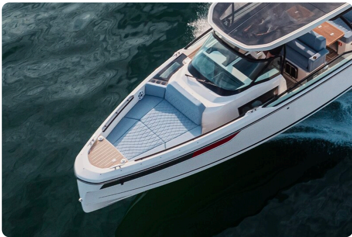
SAXDOR 270 GTO Bow sunbed