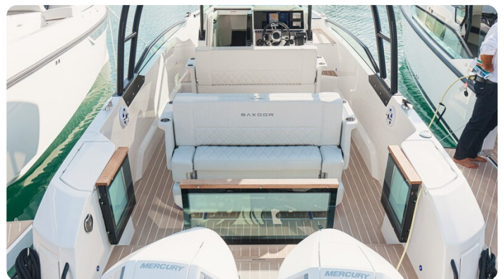
SAXDOR 270 GTO Stern