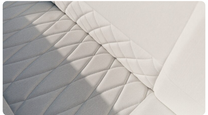
SAXDOR 270 GTO Sofa detail