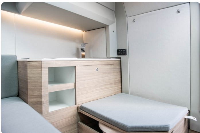
SAXDOR 270 GTO Toilette