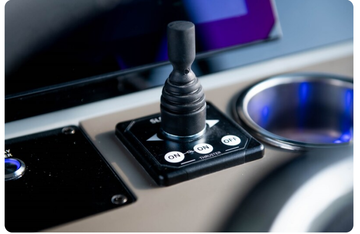
SAXDOR 270 GTO Bow thruster