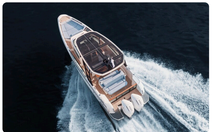
SAXDOR 270 GTO Aerial