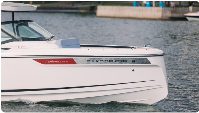
SAXDOR 270 GTO Bow detail