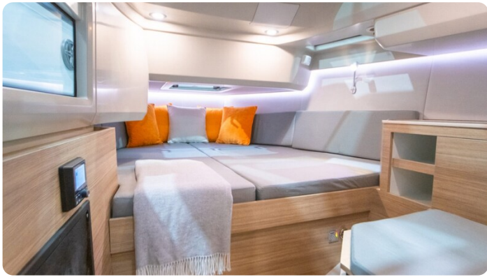
SAXDOR 270 GTO Cabin