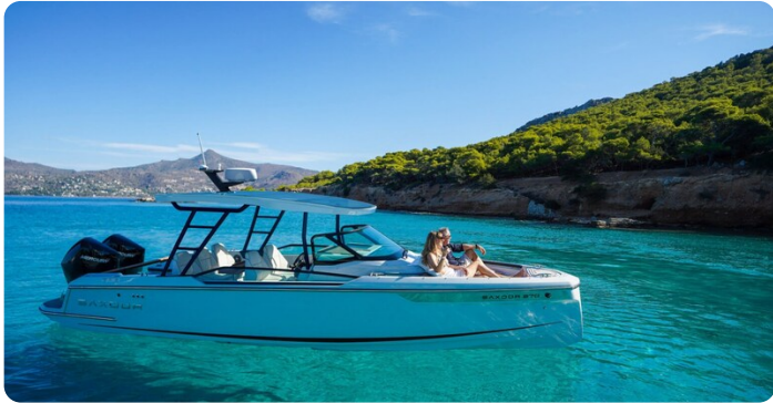
SAXDOR 270 GTO Profile