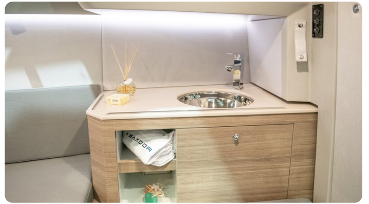
SAXDOR 270 GTO Sink