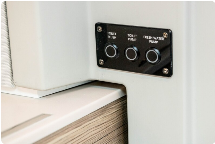
SAXDOR 270 GTO Electrical panel