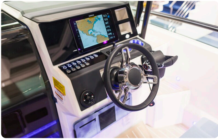
SAXDOR 270 GTO Helm