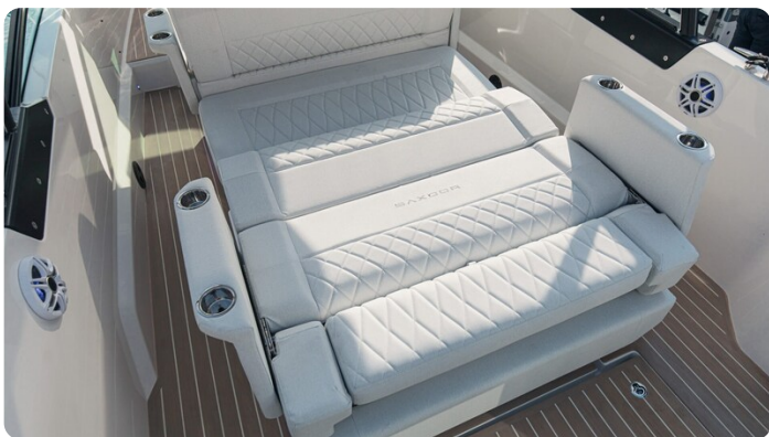
SAXDOR 270 GTO Convertible dinette