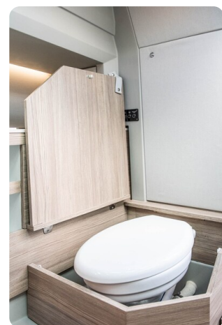
_SAXDOR 270 GTO Convertible toilette