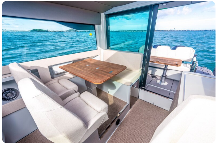
Saxdor 320 GTC salon to aft