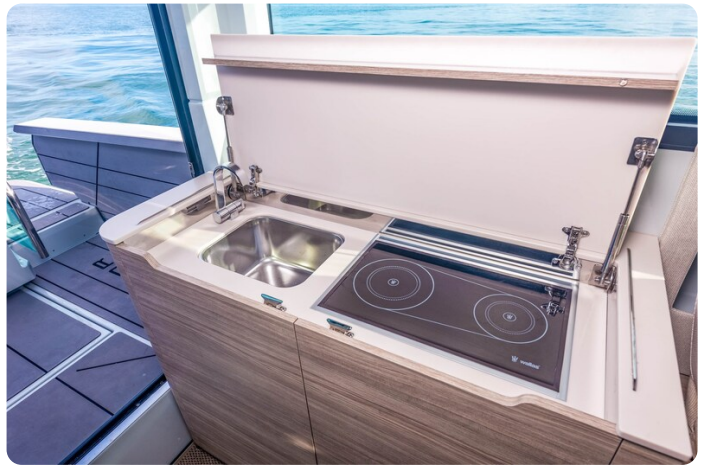
Saxdor 320 GTC galley