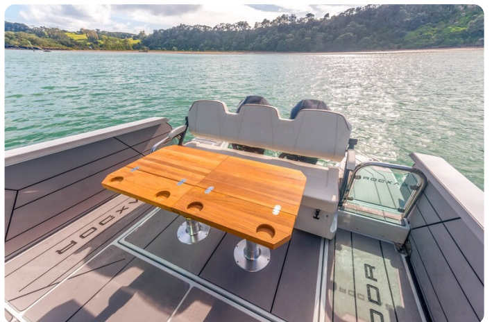
Saxdor 320 GTC cockpit dinette