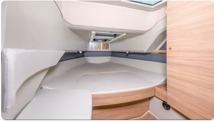
Saxdor 320 GTC cabin