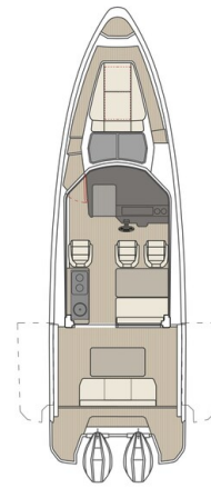
Saxdor 320 GTC Layout