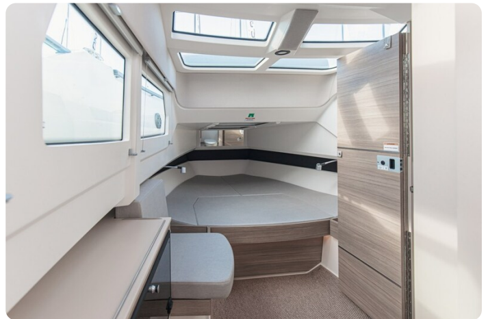
320GTO Cabin detail