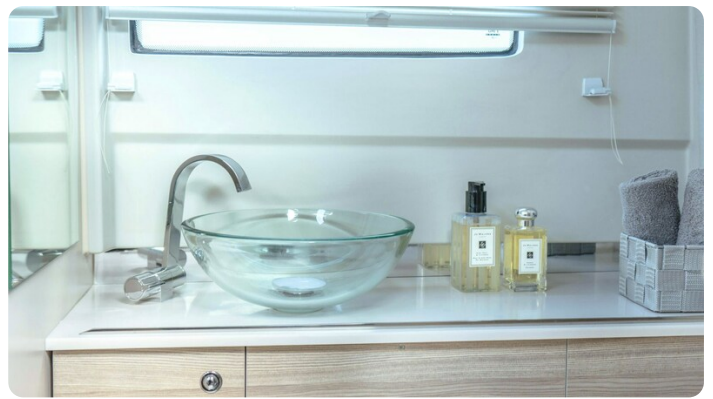
Saxdor 320 GTO toilette detail